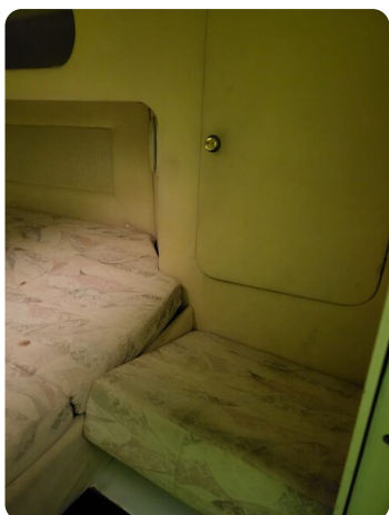
Monte Carlo 6