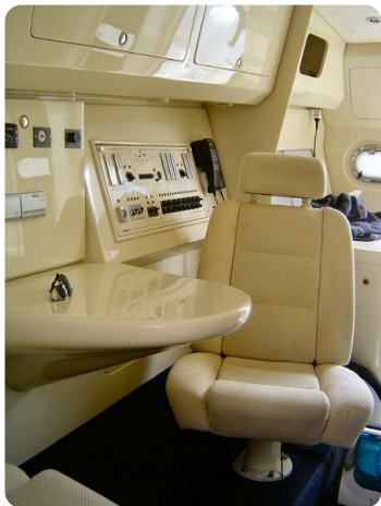
Monte Carlo 16