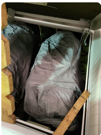
Monte Carlo 3