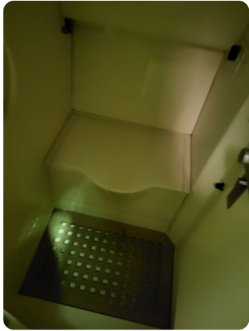
Monte Carlo 8