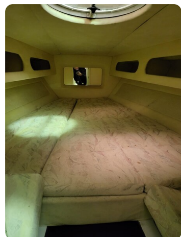
Monte Carlo 7