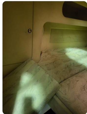
Monte Carlo 5