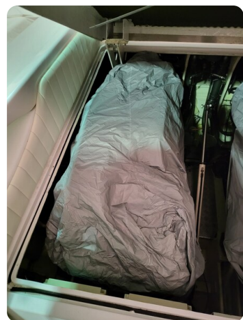
Monte Carlo 2