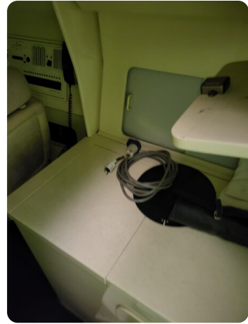
Monte Carlo 9