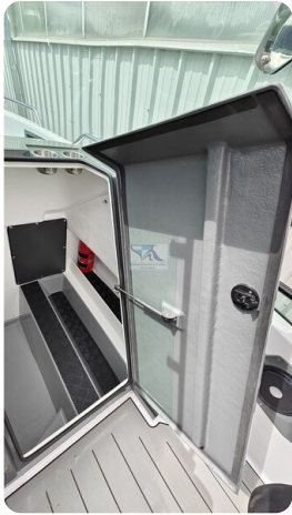
Nordkapp 705 44