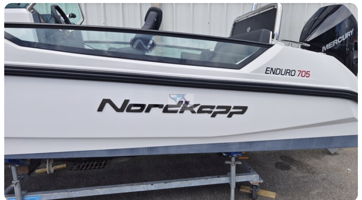
Nordkapp 705 51