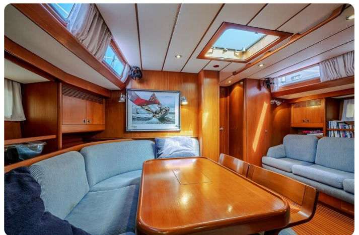
Indigo - Palma -42