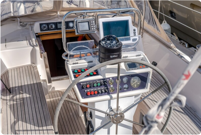
Indigo - Palma -12