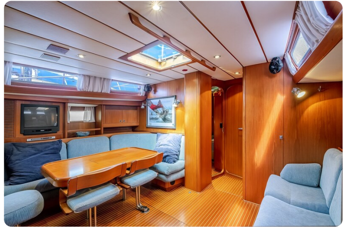
Indigo - Palma -44