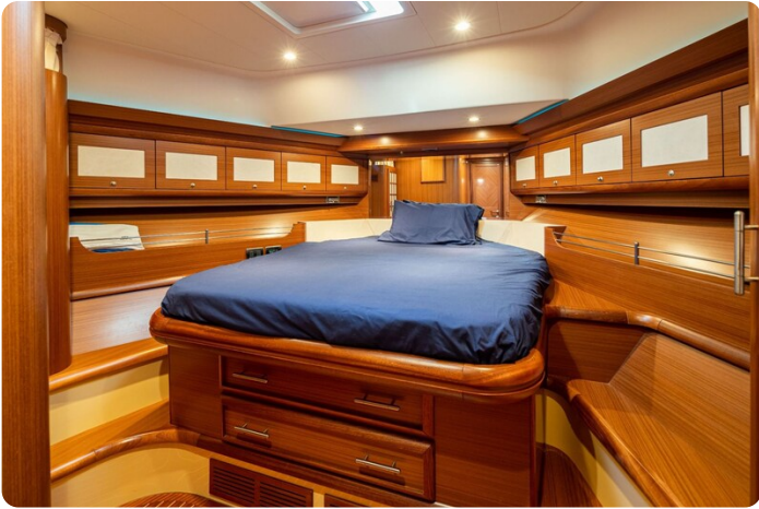
Dolphin 51 Vip cabin