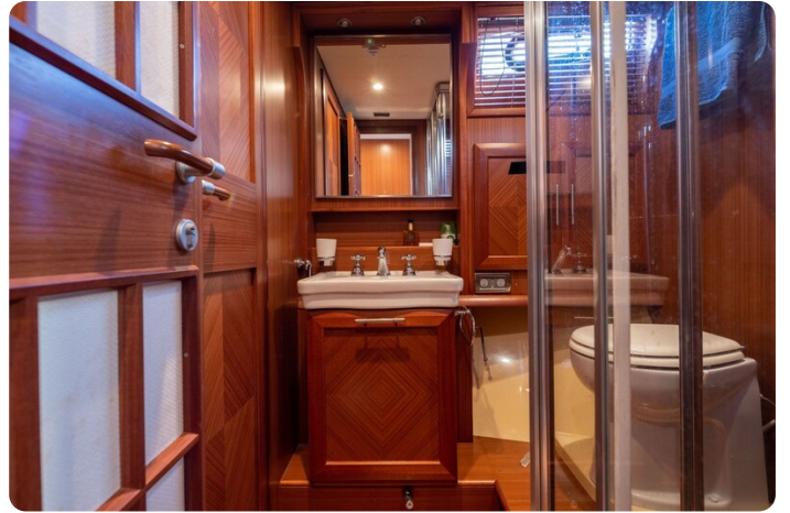
Dolphin 51 bathroom