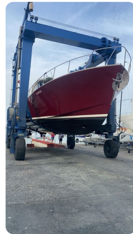
Dolphin 51 drydock