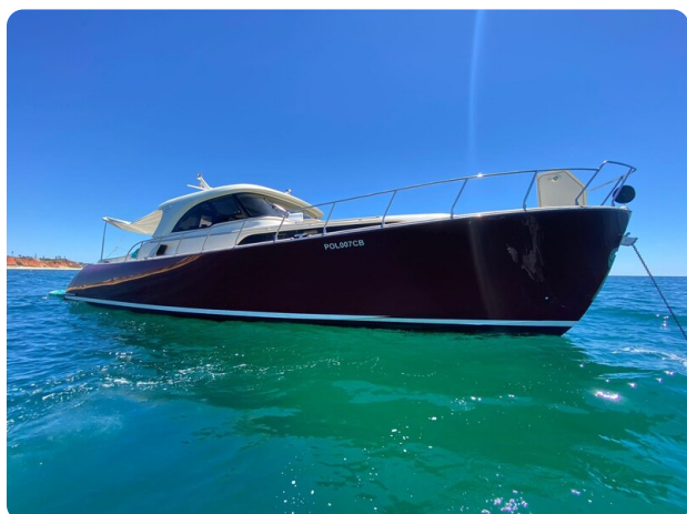
Dolphin 51 bow profile