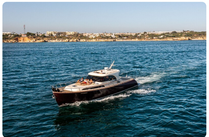
Dolphin 51 cruising