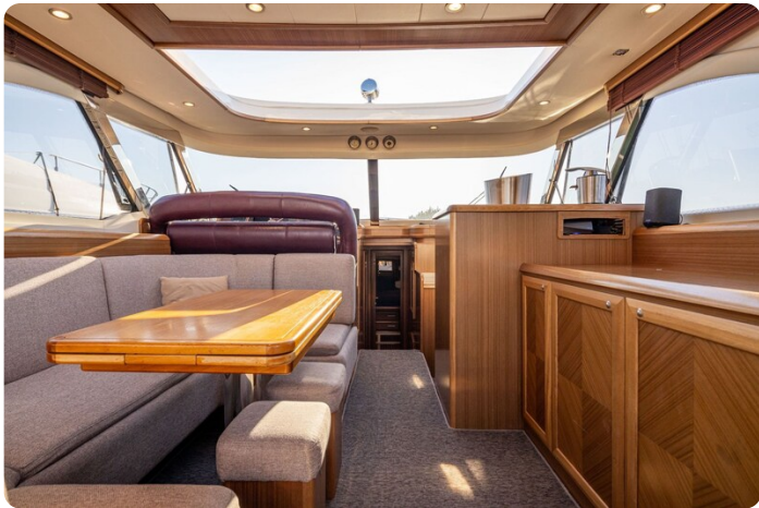
Dolphin 51 salon