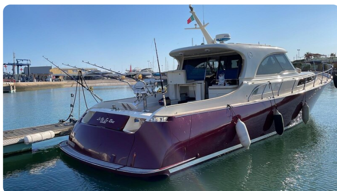
Dolphin 51 aft profile