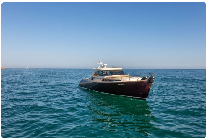
Dolphin 51 bow view