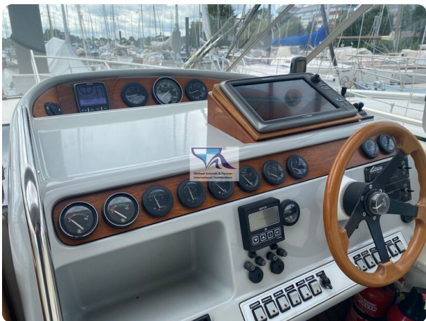
Marex 290 19