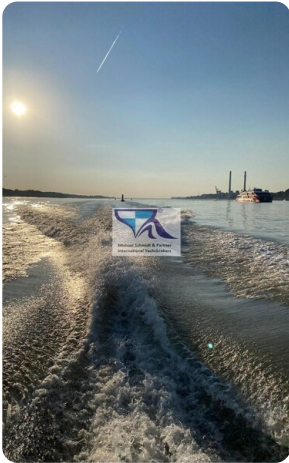
Marex 290 15