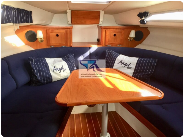
Marex 290 2