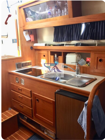
Marex 290 5