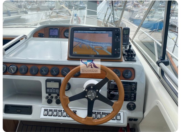
Marex 290 18