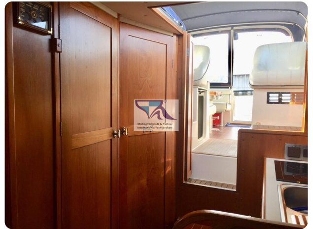
Marex 290 4