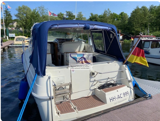
Marex 290 10