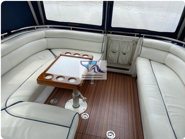
Marex 290 8