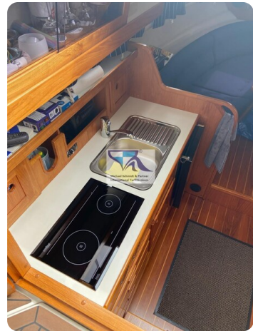
Marex 290 11