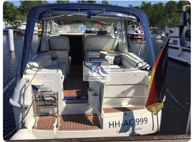
Marex 290 13