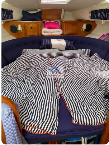
Marex 290 21