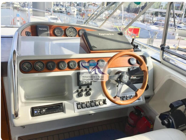
Marex 290 3