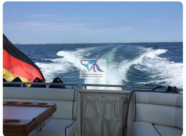
Marex 290 12