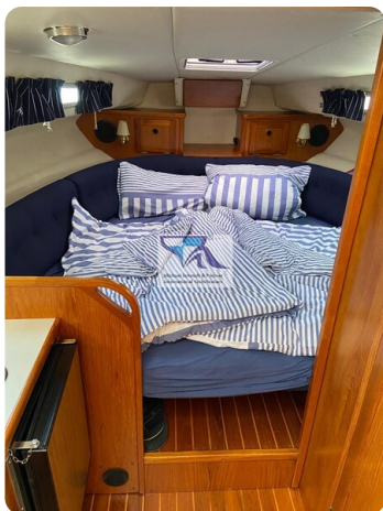
Marex 290 7