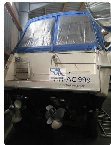
Marex 290 14