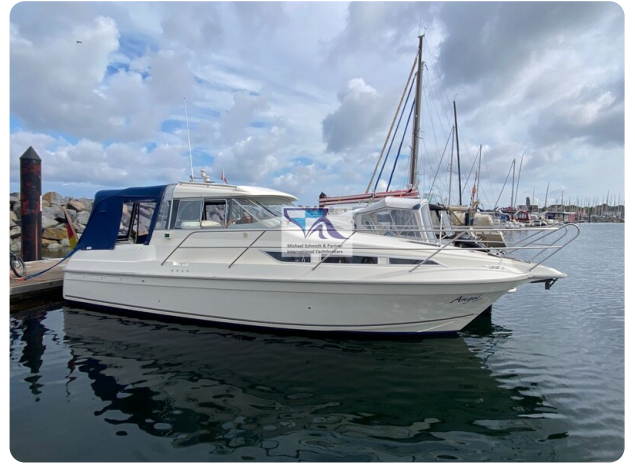
Marex 290 17