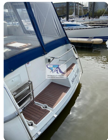
Marex 290 6