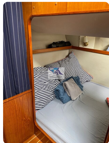
Marex 290 20