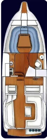
Marex 290 Sun Cruiser_Layout