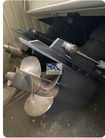
Marex 290 16