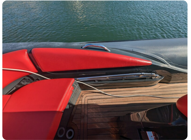
Lomac Adrenalina 7.5 detail