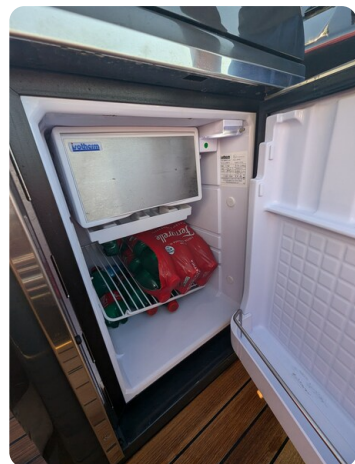
Lomac Adrenalina 7.5 fridge