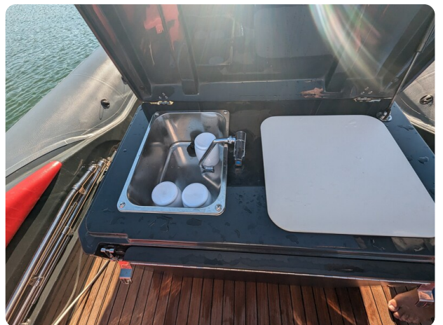
Lomac Adrenalina 7.5 sink