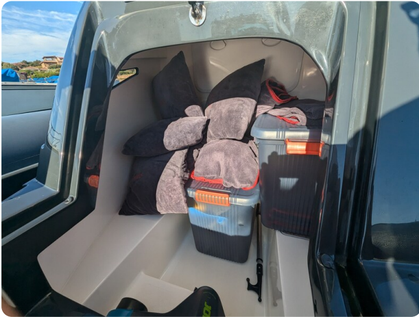
Lomac Adrenalina 7.5 storage console