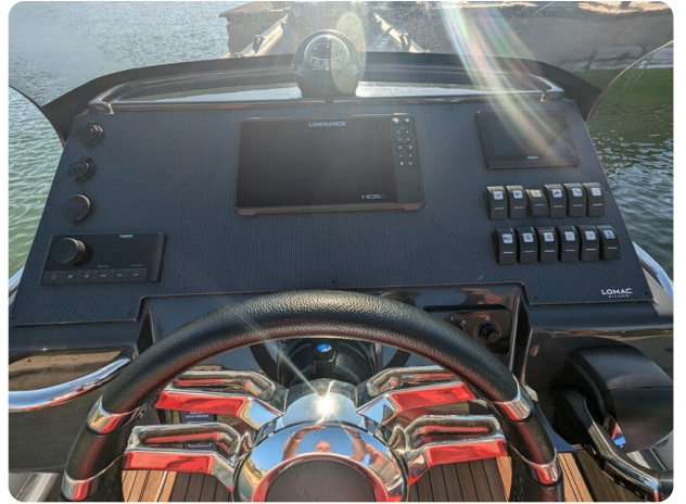
Lomac Adrenalina 7.5 helm detail