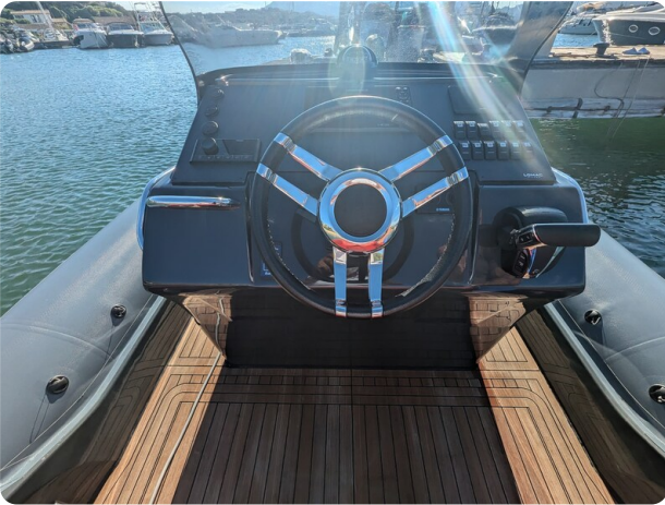
Lomac Adrenalina 7.5 helm