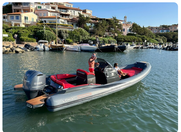
Lomac 7.50 Adrenalina aft view