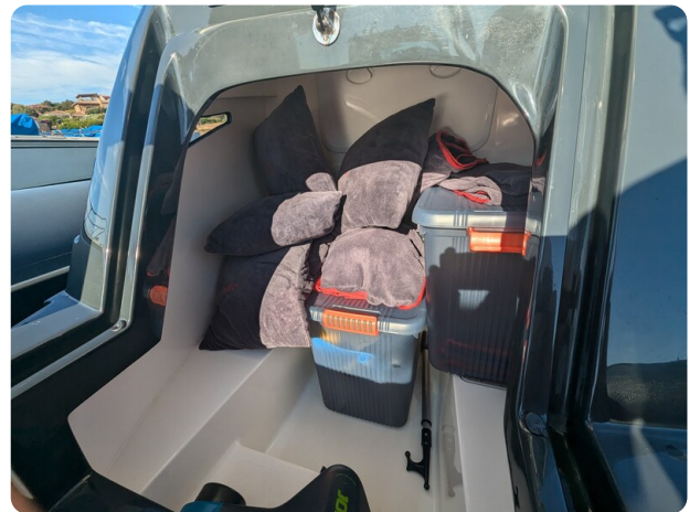
Lomac Adrenalina 7.5 storage console