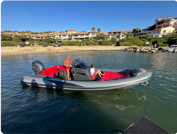
Lomac 7.50 Adrenalina view