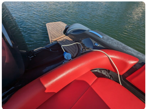
Lomac Adrenalina 7.5 shore power