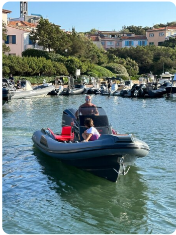
Lomac 7.50 Adrenalina bow view