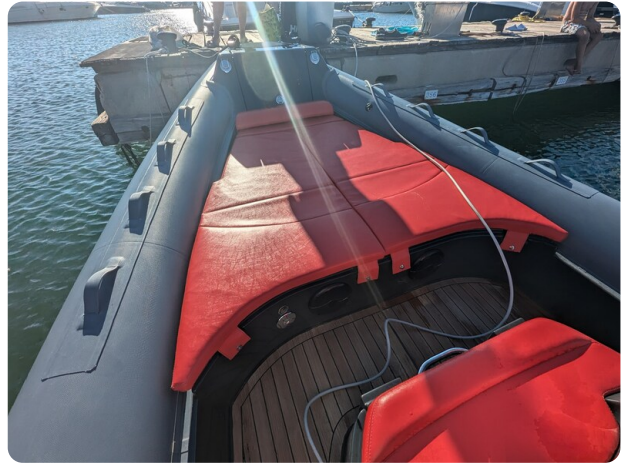
Lomac Adrenalina 7.5 bow sunpad