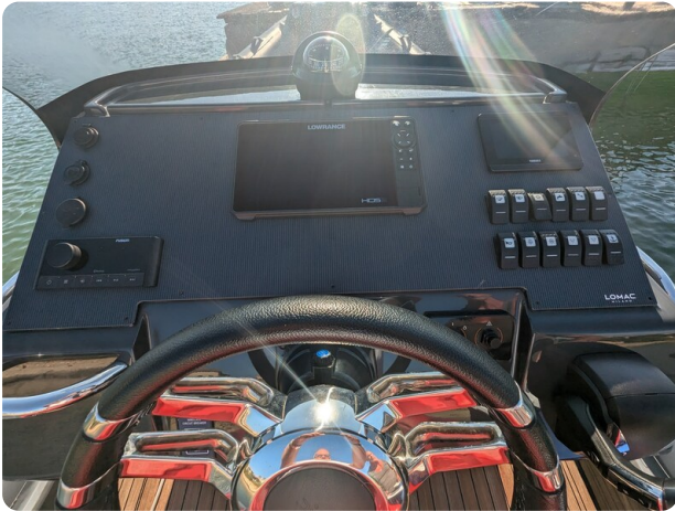
Lomac Adrenalina 7.5 helm detail