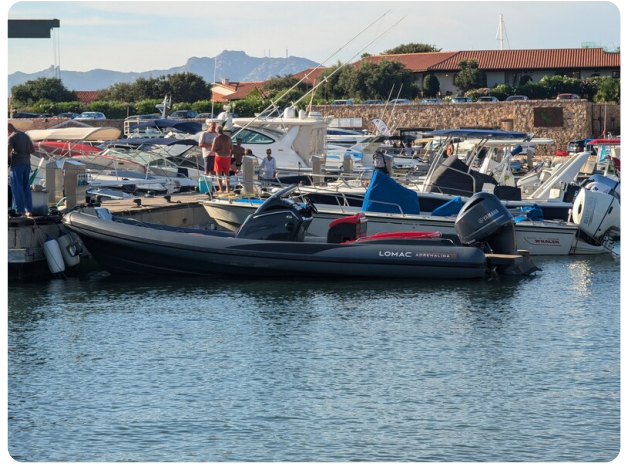
Lomac Adrenalina 7.5 view