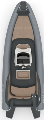
Lomac Adrenalina 7.5 layout