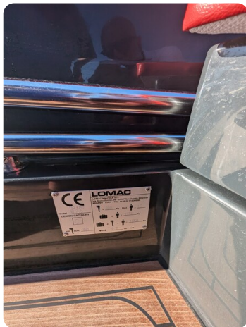
Lomac Adrenalina 7.5 CE plate