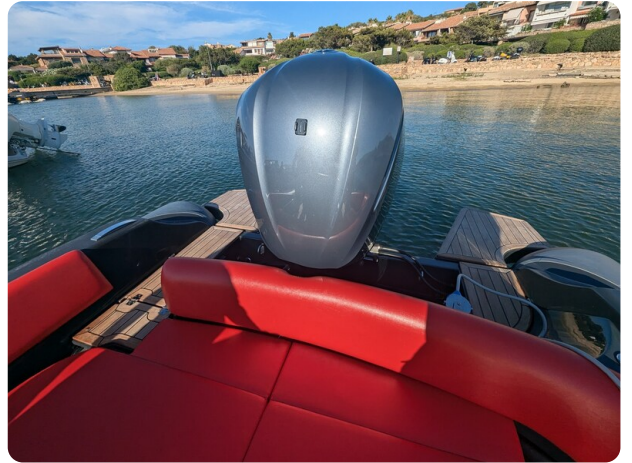
Lomac Adrenalina 7.5 stern view