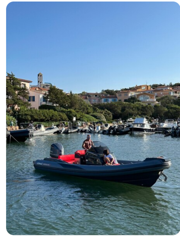
Lomac 7.50 Adrenalina bow