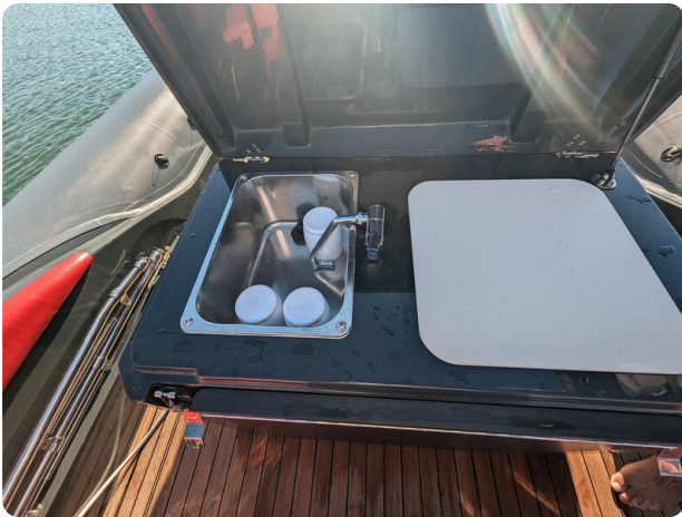
Lomac Adrenalina 7.5 sink