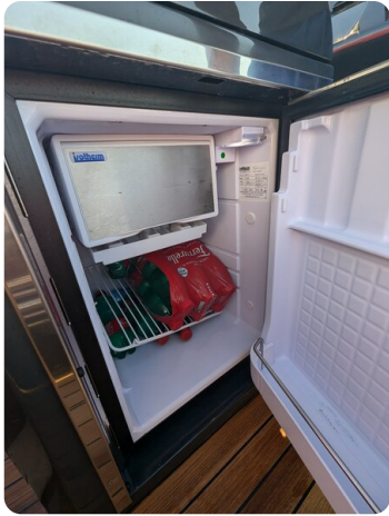
Lomac Adrenalina 7.5 fridge