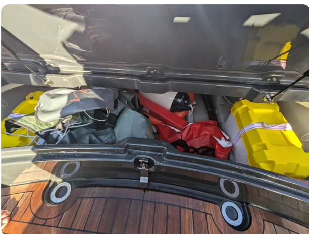
Lomac Adrenalina 7.5 storage