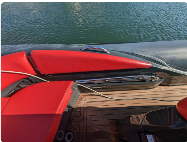
Lomac Adrenalina 7.5 detail