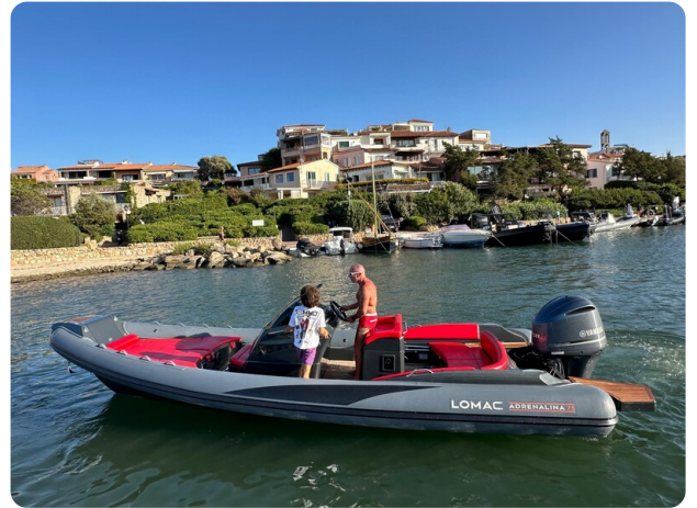
Lomac 7.50 Adrenalina profile 4