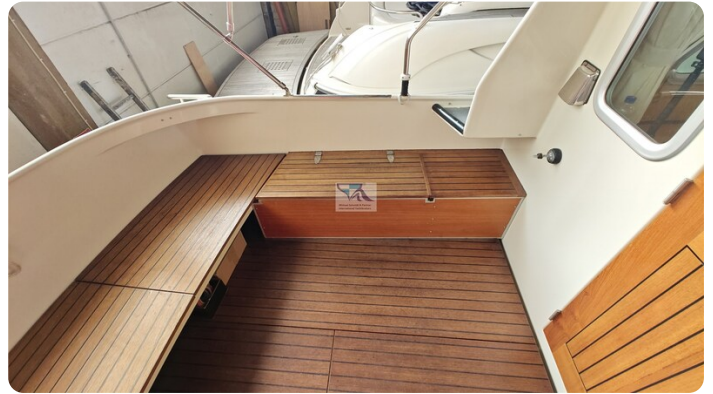
Linssen Grand Sturdy 29.9 53