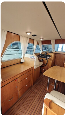
Linssen Grand Sturdy 29.9 21