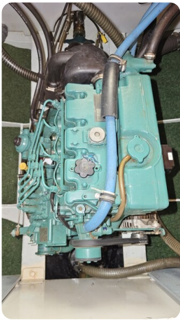
Linssen Grand Sturdy 29.9 2 - Kopie