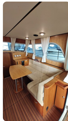
Linssen Grand Sturdy 29.9 22