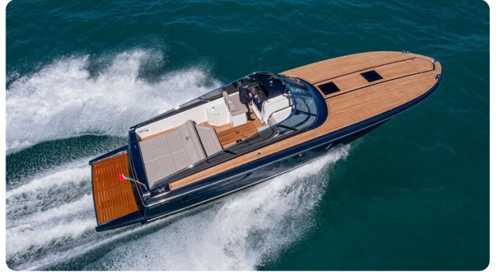
Itama 45RS aerial view