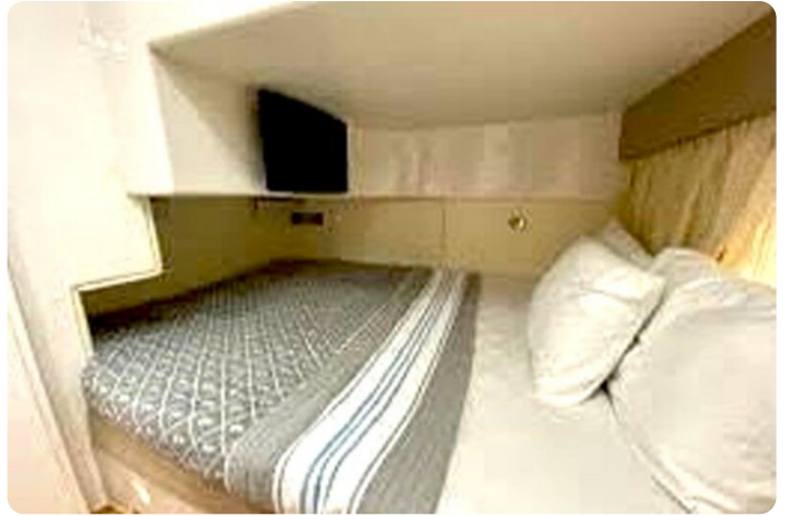
Intrepid 475 SY aft cabin