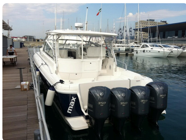
Intrepid 475 SY stern view