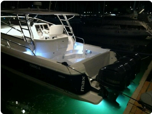
Intrepid 475 SY night view