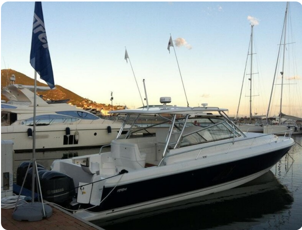
Intrepid 475 SY aft profile 2