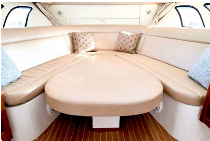
Intrepid 475 SY fwd conv dinette