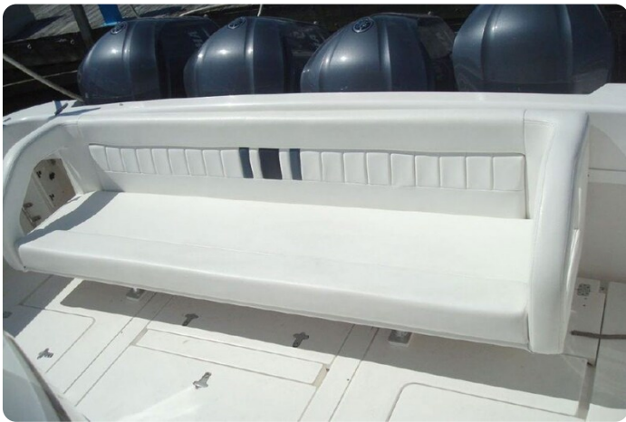
Intrepid 475 SY cockpit seating