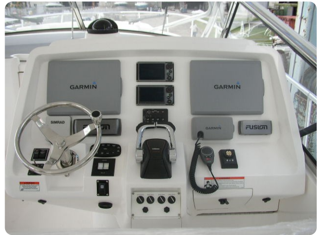
Intrepid 475 SY helm station