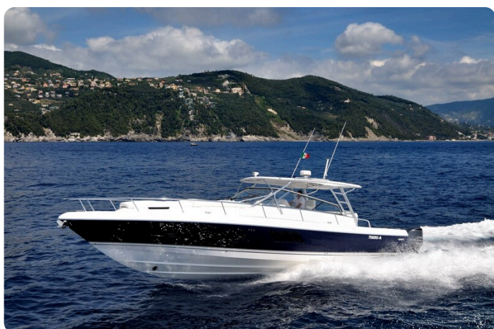
Intrepid 475 SY running