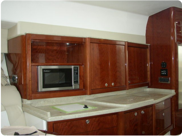
Intrepid 475 SY galley