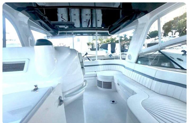
Intrepid 475 SY sistership cockpit