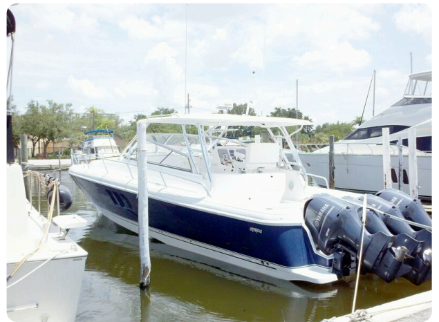
Intrepid 475 SY view