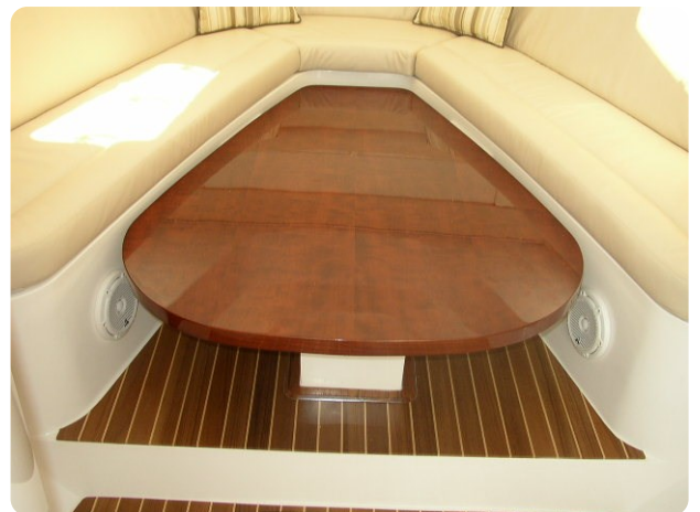
Intrepid 475 SY interior dinette