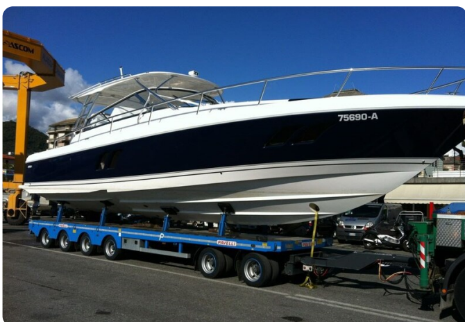
Intrepid 475 SY drydock