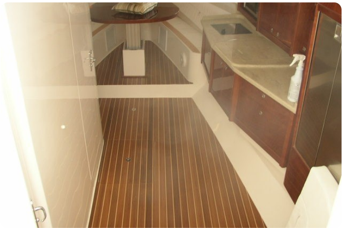
Intrepid 475 SY cabin