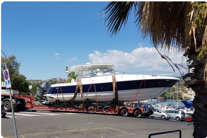
Intrepid 475 SY profile