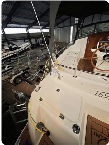
Inter cruiser 28 Cabrio ELVIRA 23