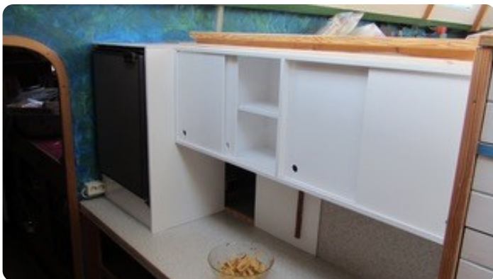
51 Küche BB