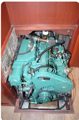
Hatecke 42 660249 100