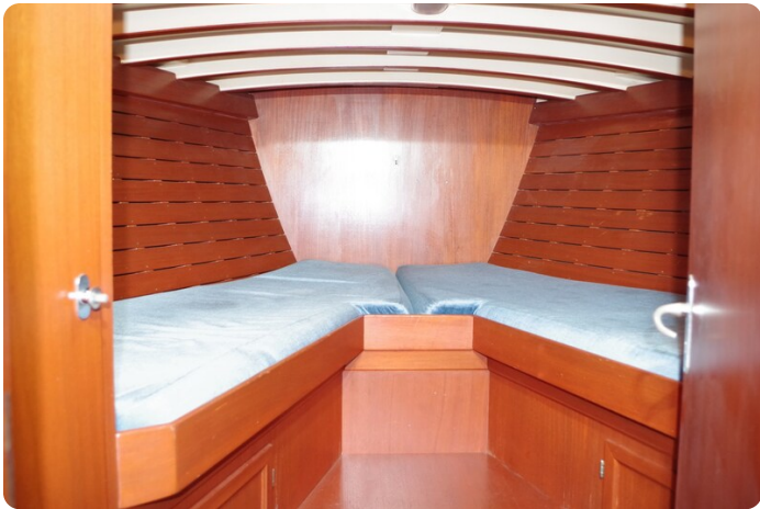
Hatecke 42 660249 58