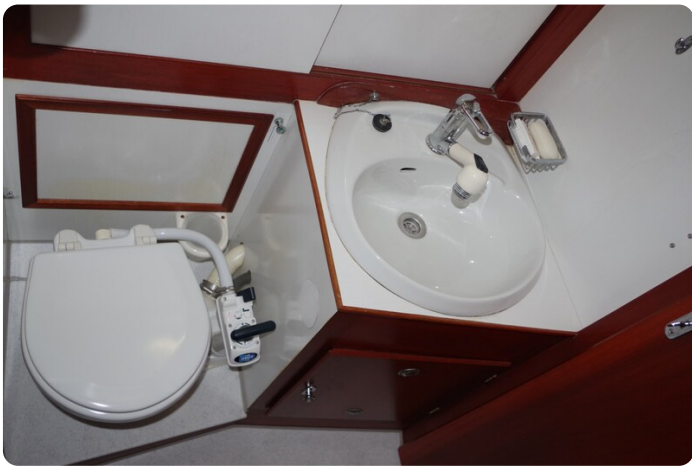
Hatecke 42 660249 42