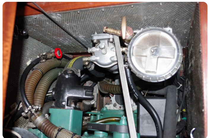
Hatecke 42 660249 125