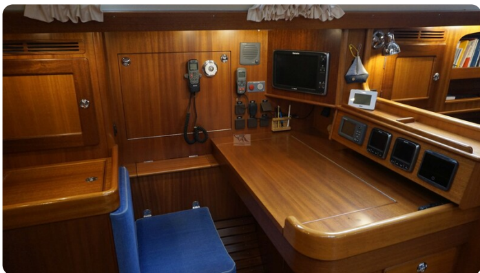
Hallberg Rassy 48 AURORA 27