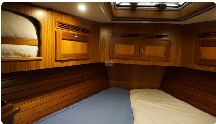
Hallberg Rassy 48 AURORA 39