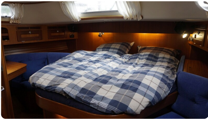
Hallberg Rassy 48 AURORA 31