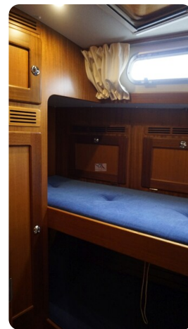
Hallberg Rassy 48 AURORA 42