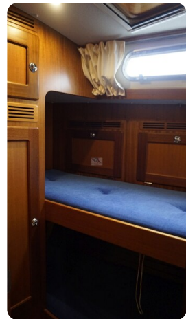
Hallberg Rassy 48 AURORA 42