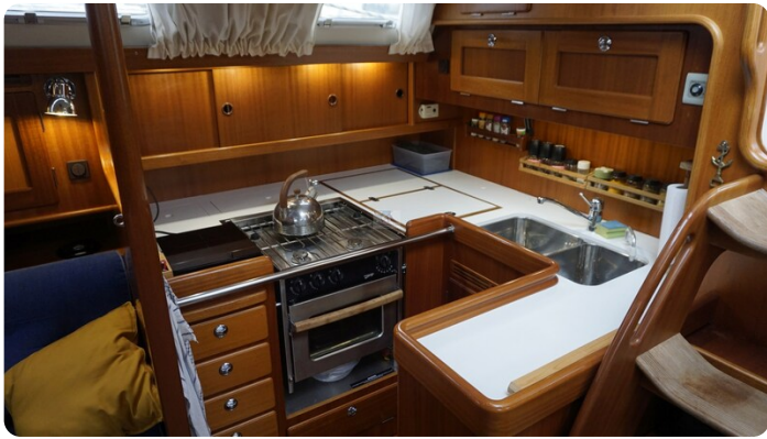
Hallberg Rassy 48 AURORA 23