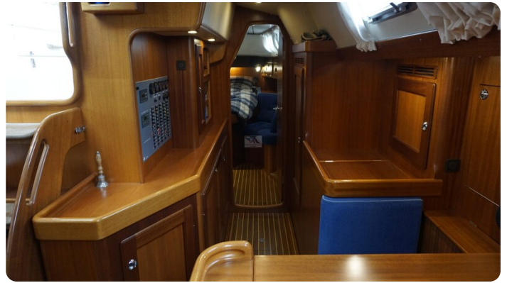
Hallberg Rassy 48 AURORA 28