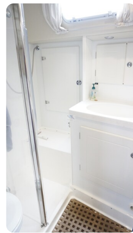
Hallberg Rassy 48 AURORA 34