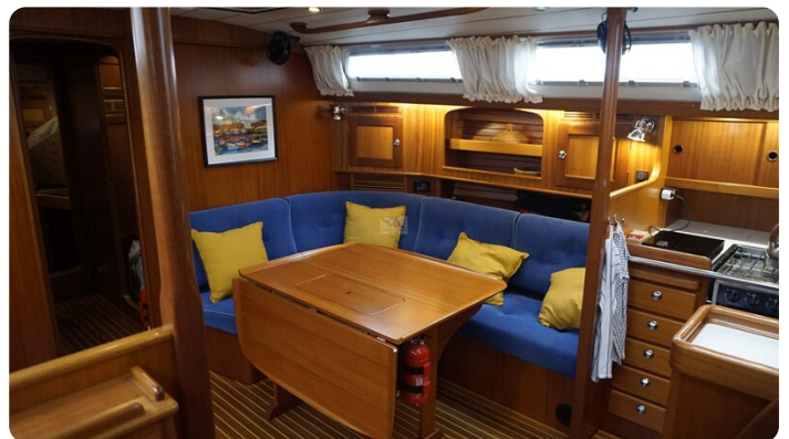
Hallberg Rassy 48 AURORA 51