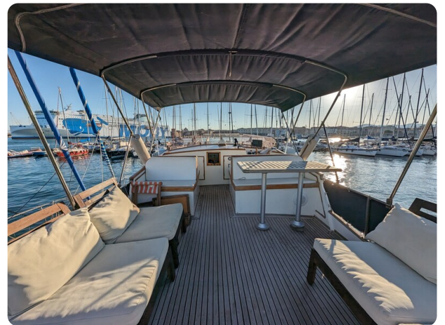
Grand Banks 42 Classic Fly dinette