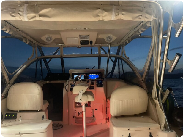
Grady White 305 express