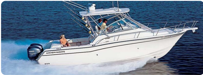
Grady White 305 express sistership