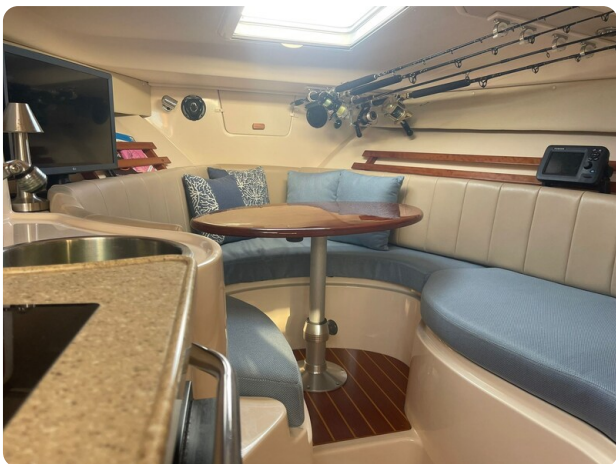
Grady White 305 express