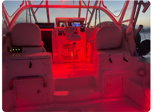
Grady White 305 express