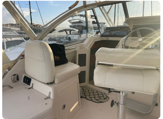
Grady White 305 express