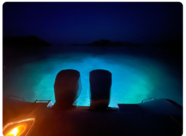
Grady White 305 express