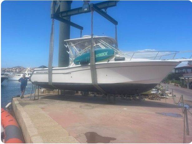
Grady White 305 express