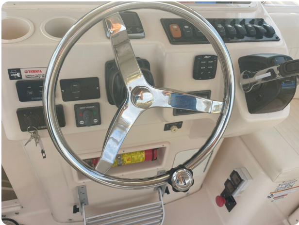
Grady White 305 express