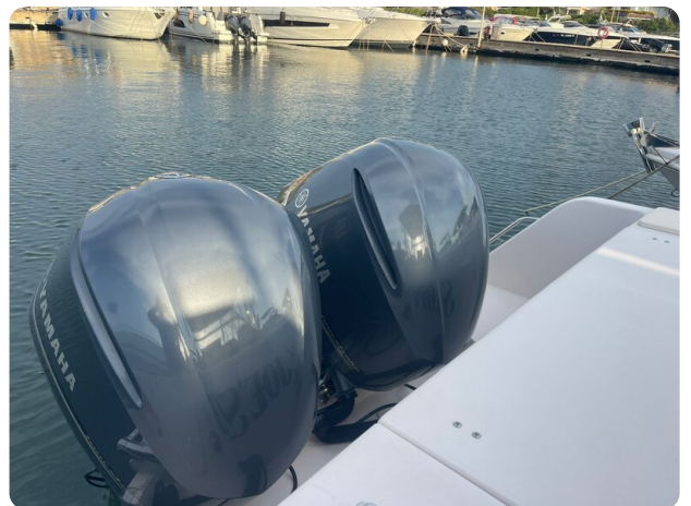
Grady White 305 express