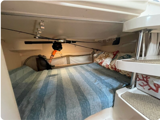
Grady White 305 express