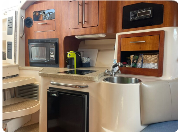
Grady White 305 express