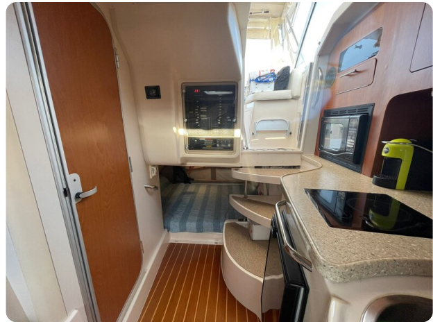
Grady White 305 express