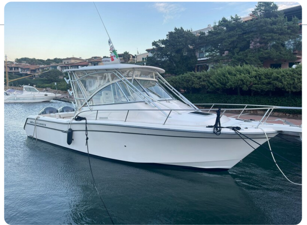
Grady White 305 express