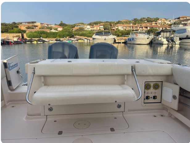
Grady White 305 express