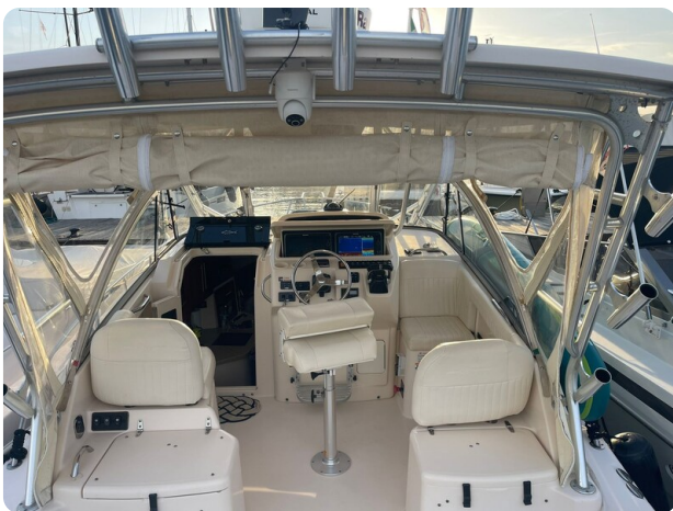
Grady White 305 express