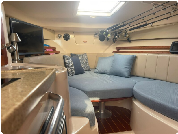
Grady White 305 express