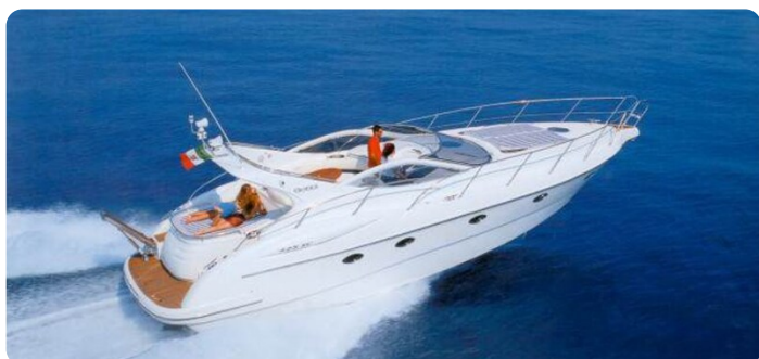
Gobbi sister ship