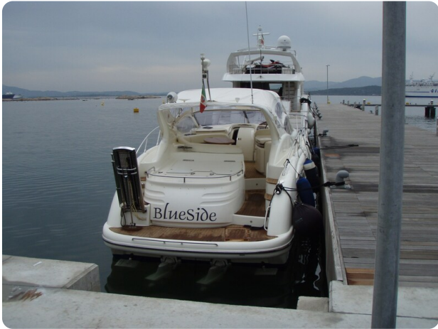
Gobbi 425 esterno (5)