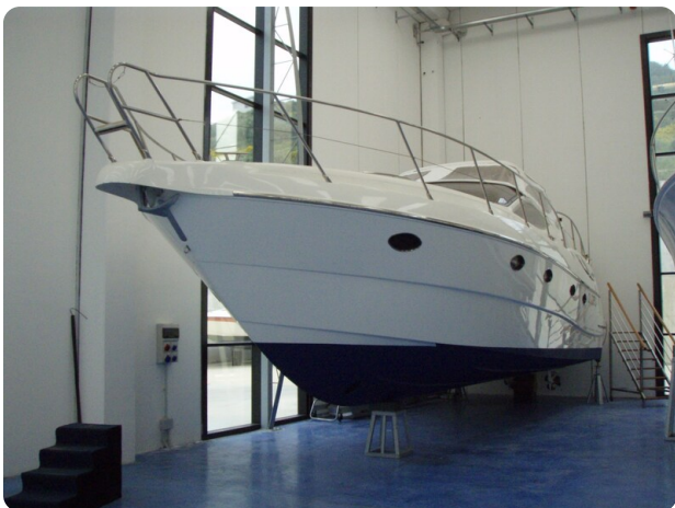
Gobbi 425 esterno (4)