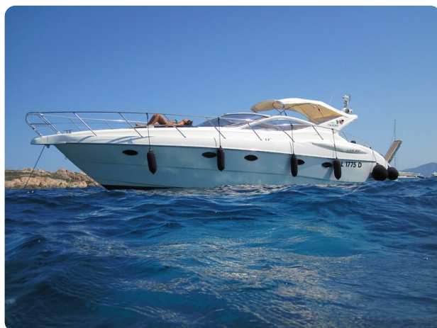
Gobbi 425 esterno (2)