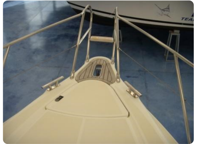
Gobbi 425 esterno (11)