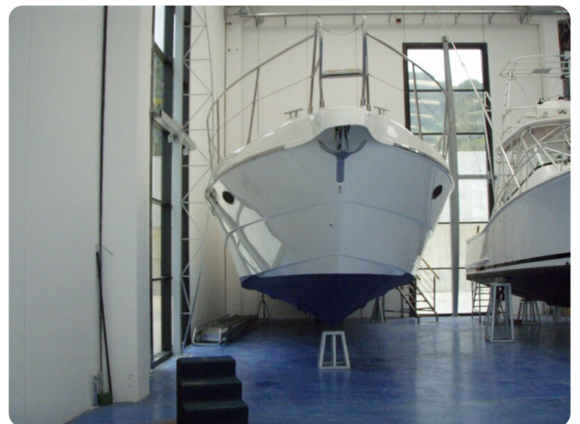
Gobbi 425 esterno (6)