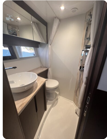
Galeon 485 HTS bathroom