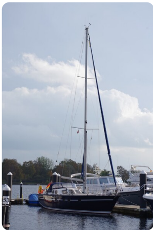
SKORPION II ESTRELLA 21