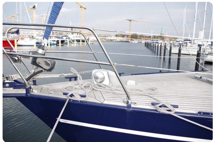
SKORPION II ESTRELLA 9