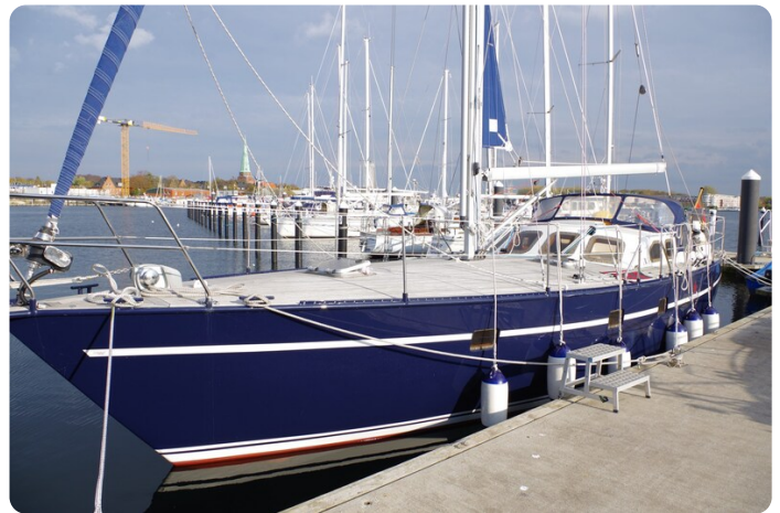
SKORPION II ESTRELLA 15