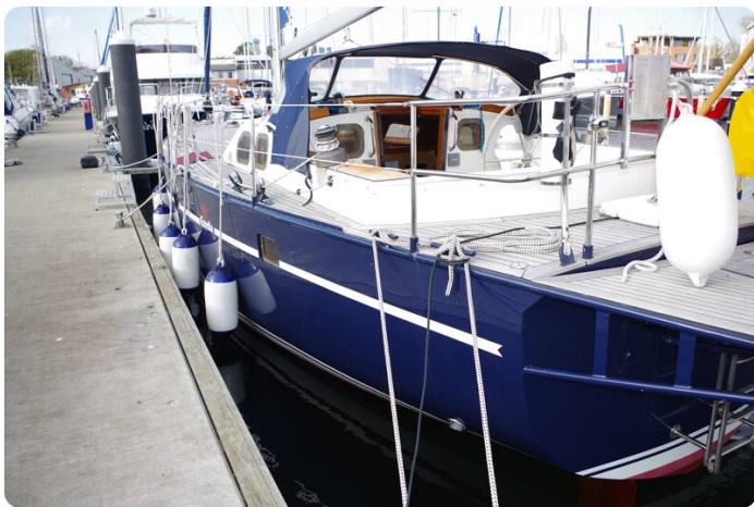
SKORPION II ESTRELLA 6