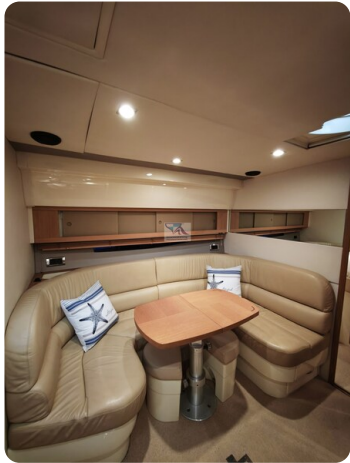
Fairline Targa 38 17