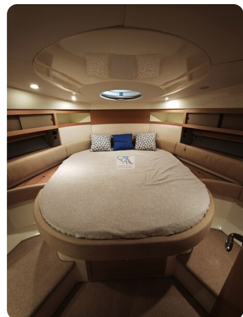
Fairline Targa 38 23