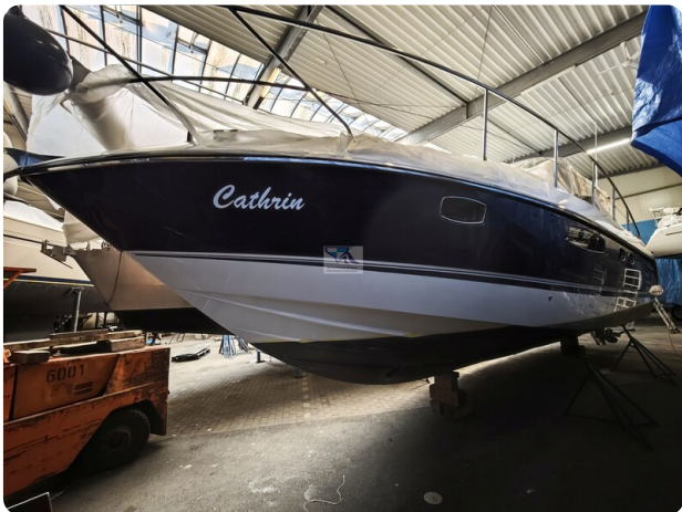
Fairline Targa 38 57