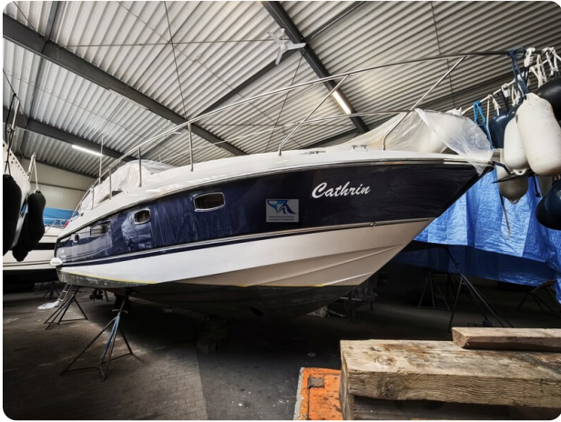
Fairline Targa 38 56