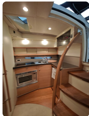
Fairline Targa 38 32