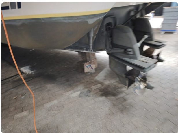
Fairline Targa 38 52