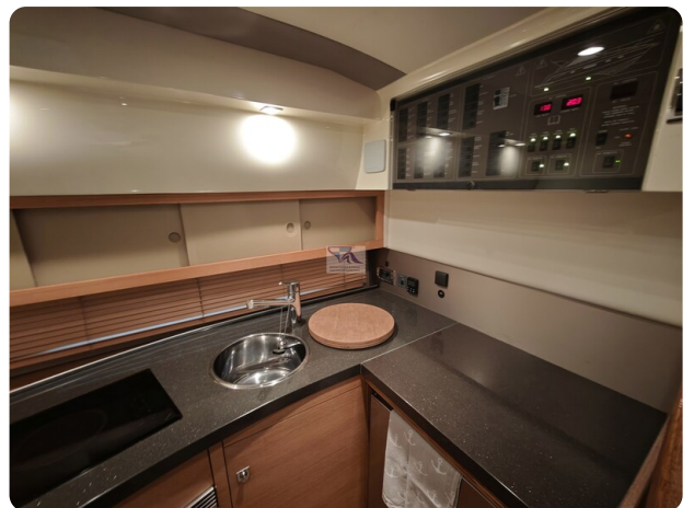
Fairline Targa 38 9