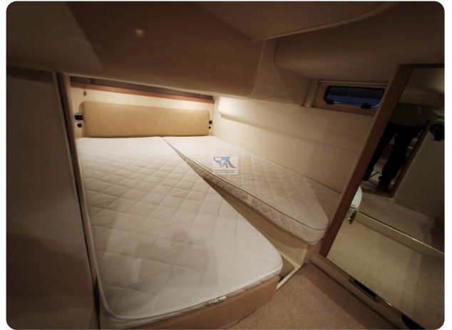
Fairline Targa 38 41