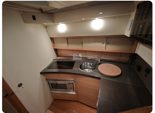
Fairline Targa 38 3