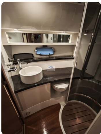
Fairline Targa 38 48