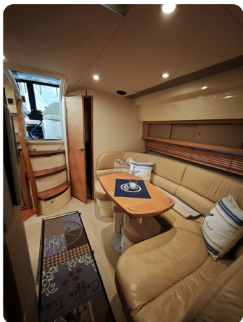
Fairline Targa 38 1