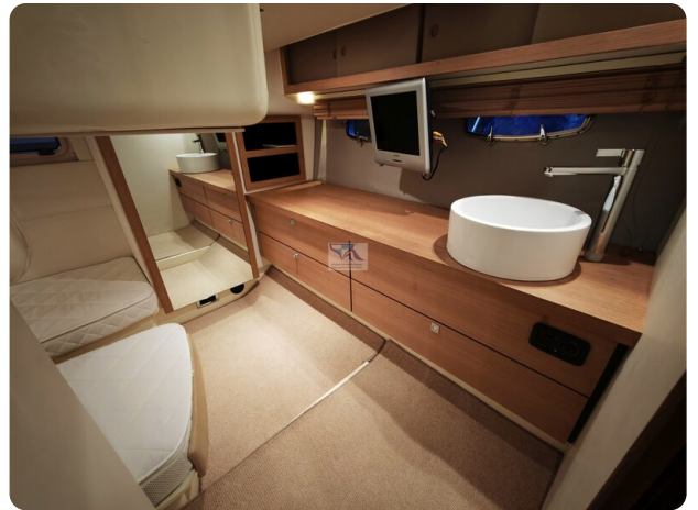
Fairline Targa 38 38