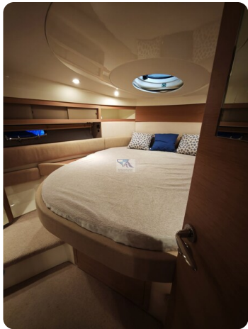
Fairline Targa 38 50