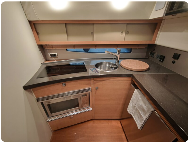
Fairline Targa 38 14