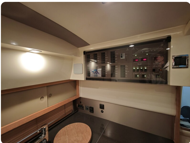
Fairline Targa 38 8