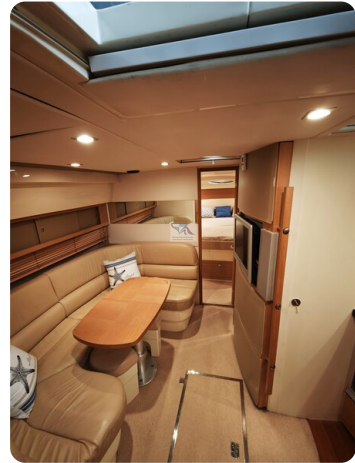
Fairline Targa 38 5