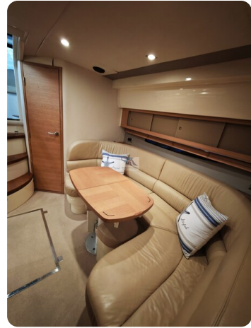
Fairline Targa 38 29