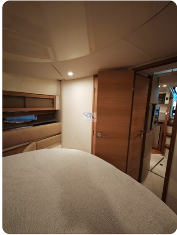
Fairline Targa 38 27