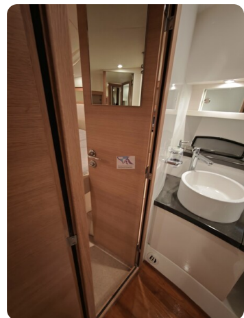
Fairline Targa 38 49