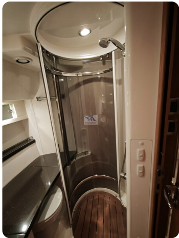
Fairline Targa 38 36