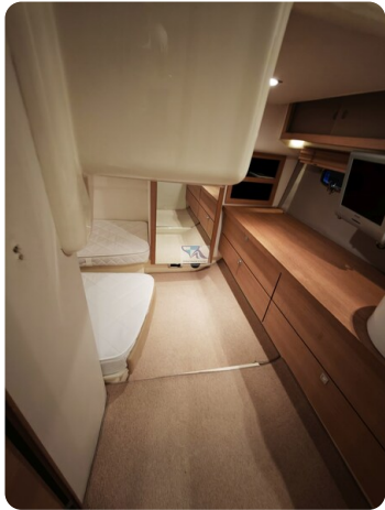
Fairline Targa 38 40