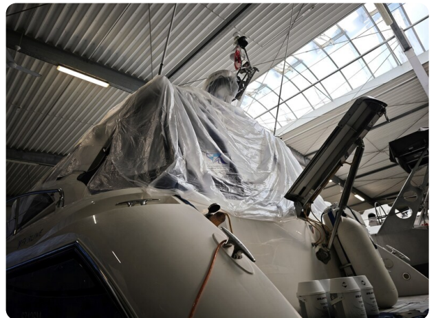
Fairline Targa 38 54