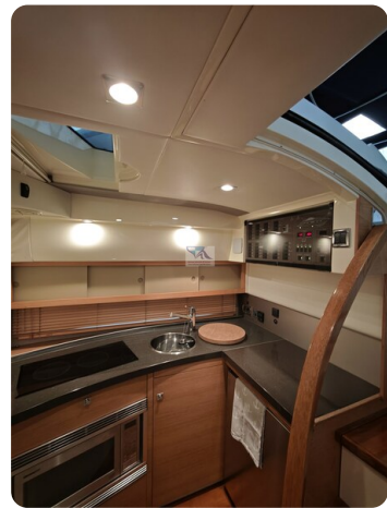
Fairline Targa 38 7