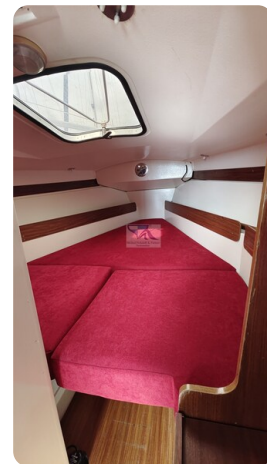
Etap 23i 1