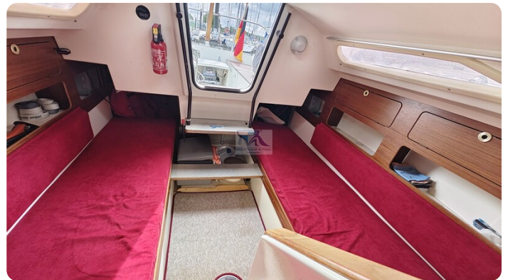
Etap 23i 13