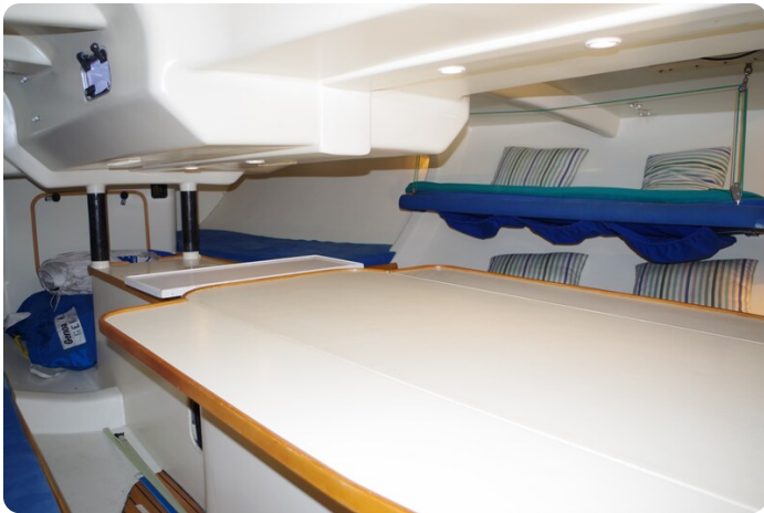
MSP_5280 - Kopie