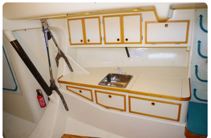
MSP_5304 - Kopie