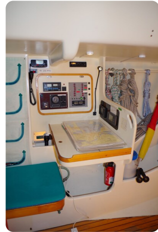
MSP_5277 - Kopie