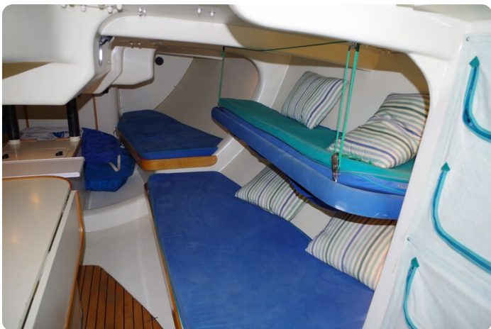
MSP_5271 - Kopie