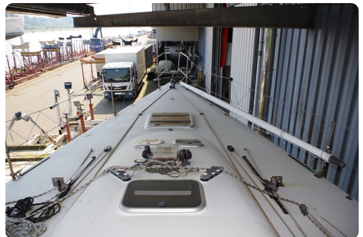
MSP_5245 - Kopie