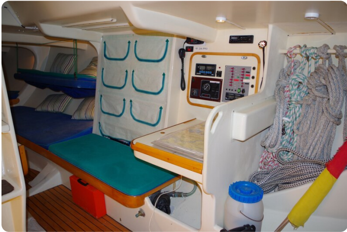
MSP_5276 - Kopie