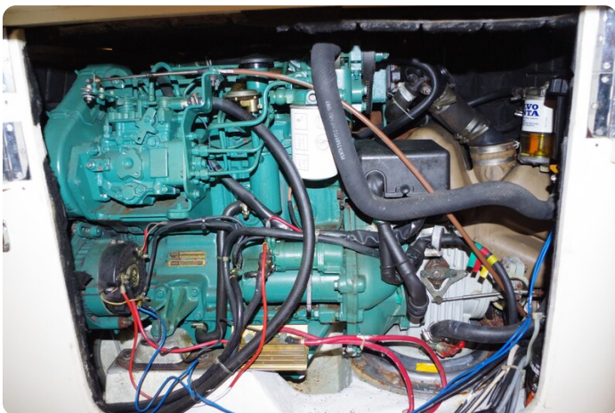
MSP_5286 - Kopie