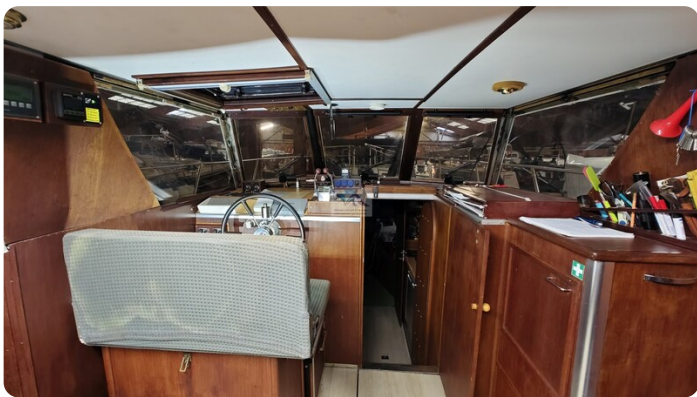
Reinke Tourina 10m_35