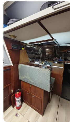
Reinke Tourina 10m_37