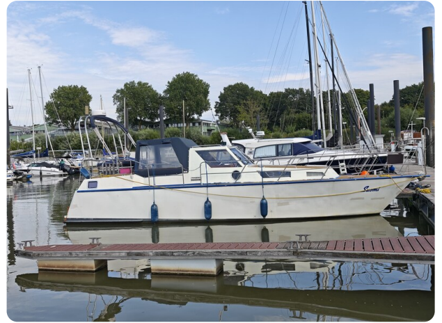
Reinke Tourina 10m SUOMI 1