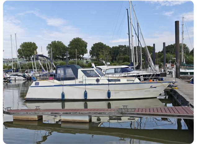
Reinke Tourina 10m SUOMI 3