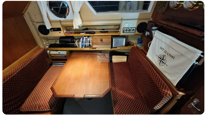
Reinke Tourina 10m_12