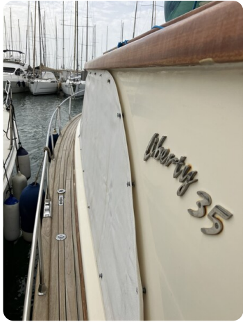
Liberty 35 Detail