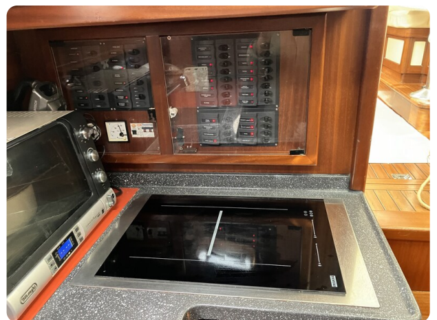
Liberty 35 Cockpit Galley Detail