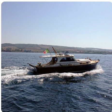
Liberty 35 Profile