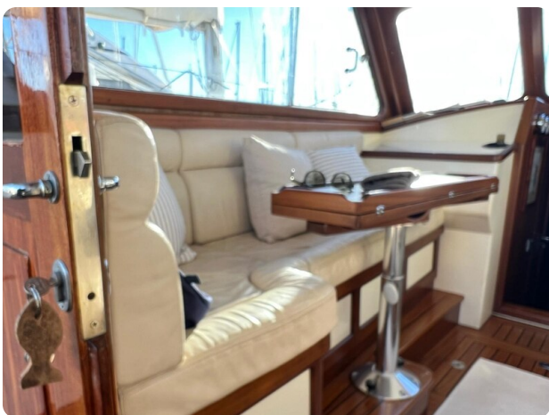
Liberty 35 dinette