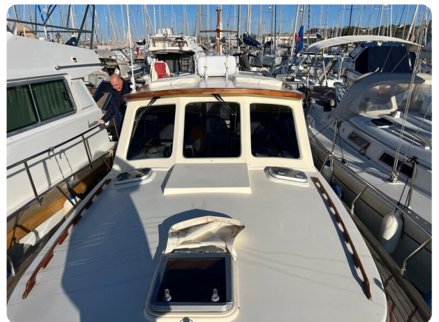
Liberty 35 fwd deck