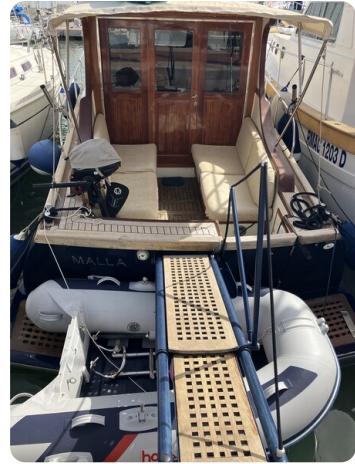
Liberty 35 Stern View