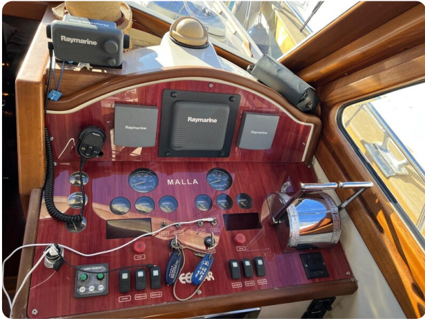
Liberty 35 helm