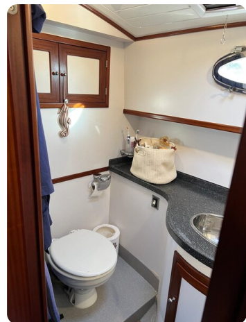
Liberty 35 head