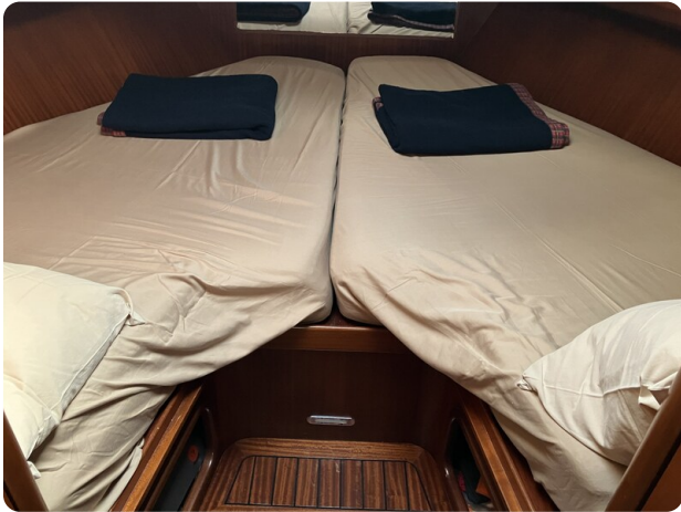
Liberty 35 Cabin