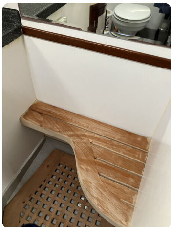
Liberty 35 Shower