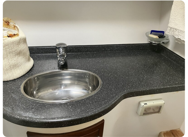
Liberty 35 Head