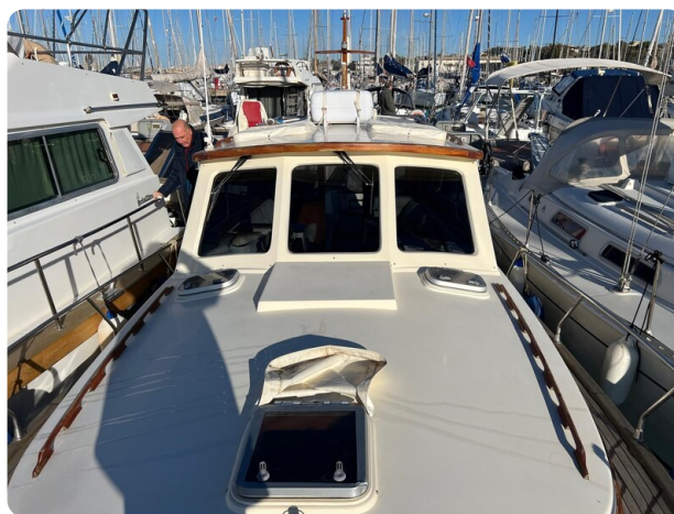
Liberty 35 fwd deck