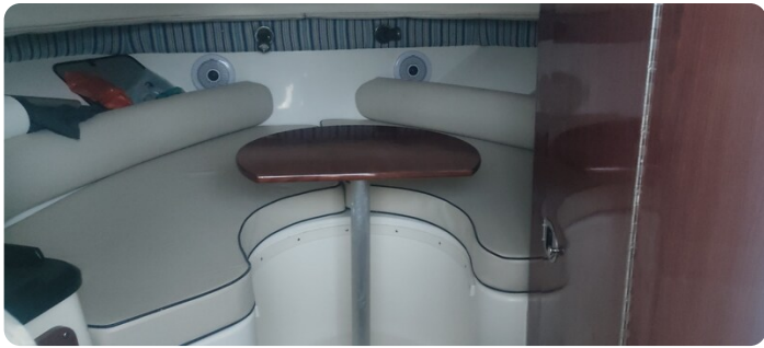
Edge Water 265 ex-12