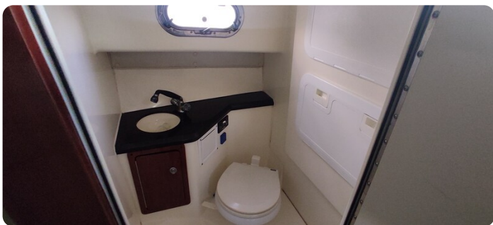
Edge Water 265 ex-4