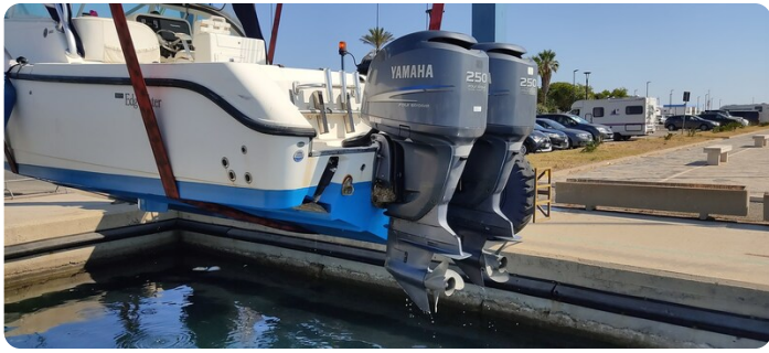
Edge Water 265 ex-8