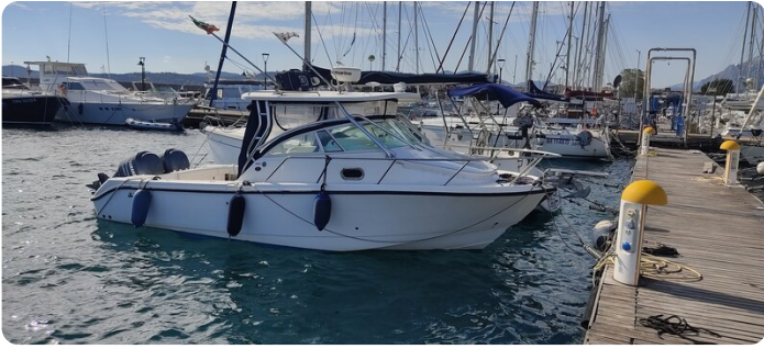
Edge Water 265 ex-2