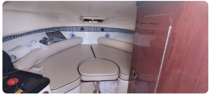
Edge Water 265 ex-5