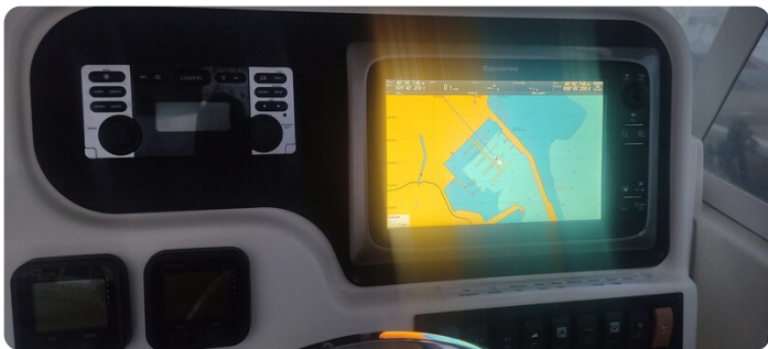
Edge Water 265 ex-14