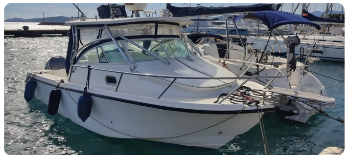
Edge Water 265 ex-1