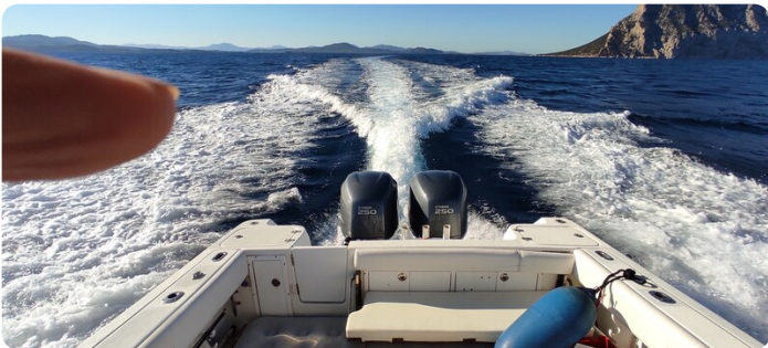
Edge Water 265 ex-3