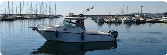
Edge water 265 express