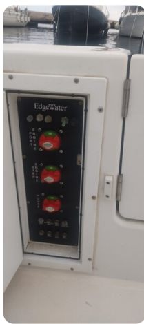
Edge Water 265 ex-15