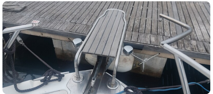
Edge Water 265 ex-11