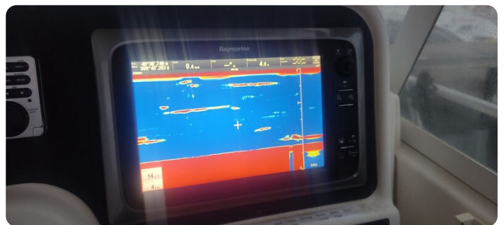
Edge Water 265 ex-13