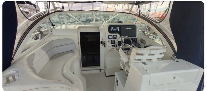
Edge Water 265 ex-6