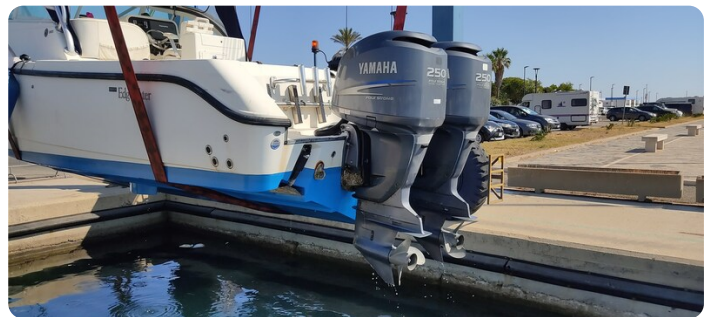
Edge Water 265 ex-7