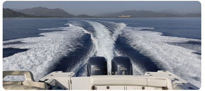
Edge Water 265 ex-9