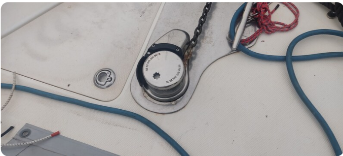
Edge Water 265 ex-10