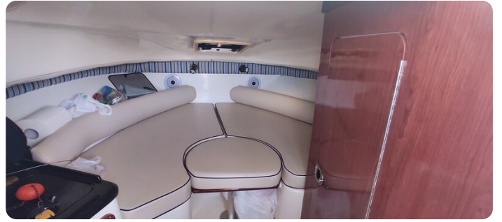
Edge Water 265 ex-5