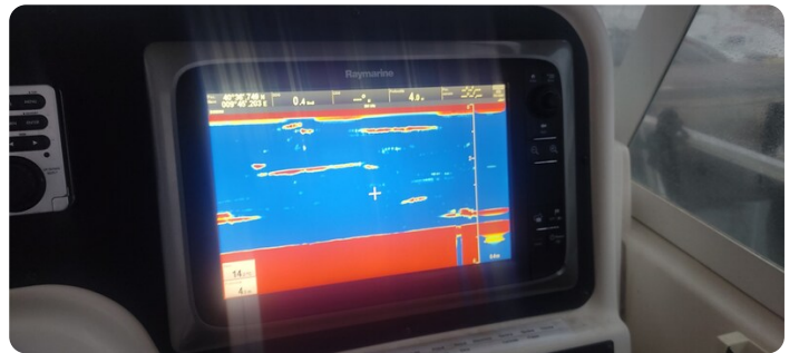
Edge Water 265 ex-13