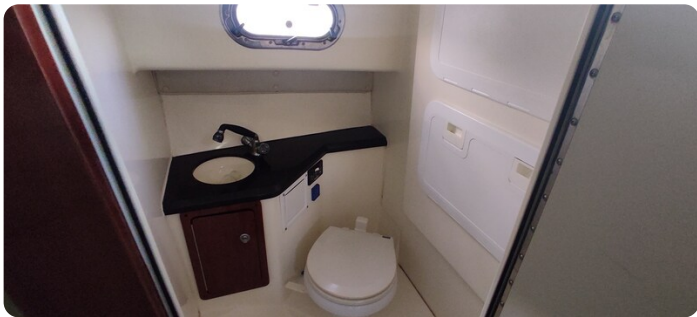
Edge Water 265 ex-4