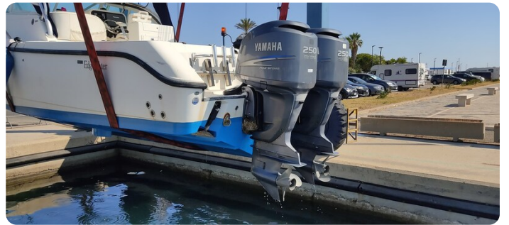
Edge Water 265 ex-7