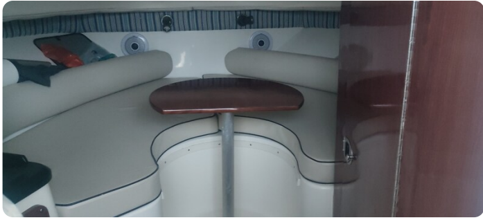
Edge Water 265 ex-12