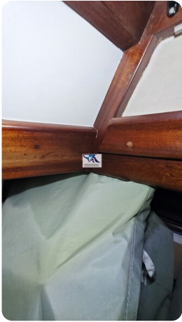
Marken II_msp797539 115