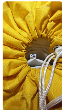
Marken II_msp797539 110