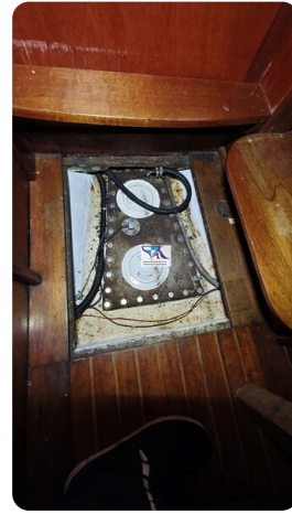
Marken II_msp797539 97