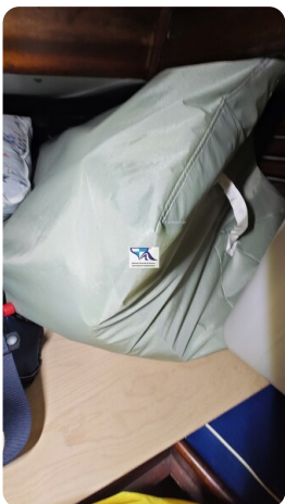
Marken II_msp797539 111