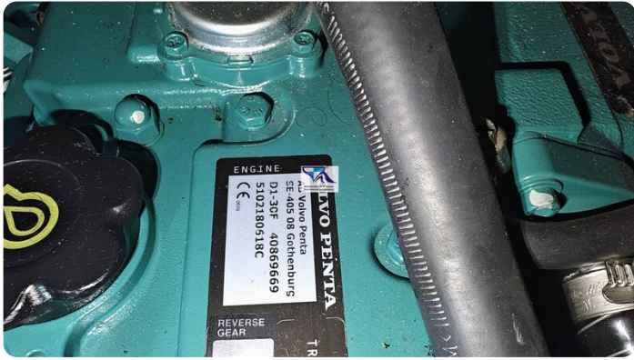
Marken II_msp797539 121