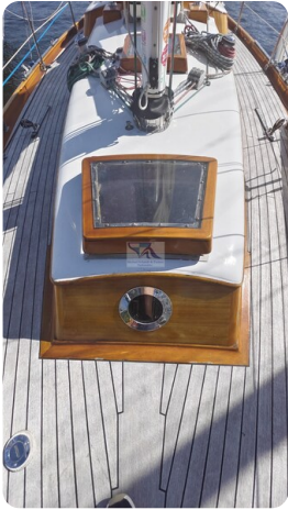
6 KR De Dood 6