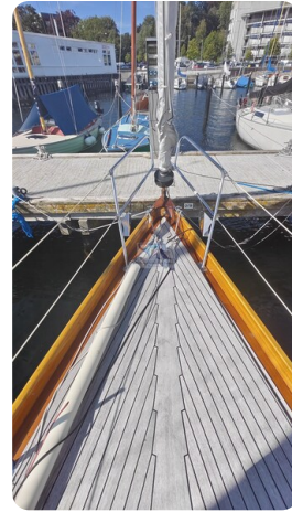
6 KR De Dood 7