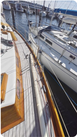
6 KR De Dood 9