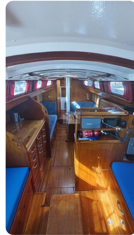
6 KR De Dood 12