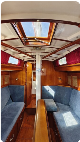
6 KR De Dood 22