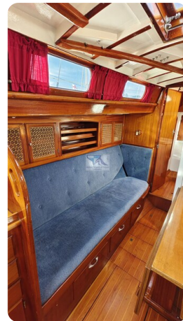
6 KR De Dood 21