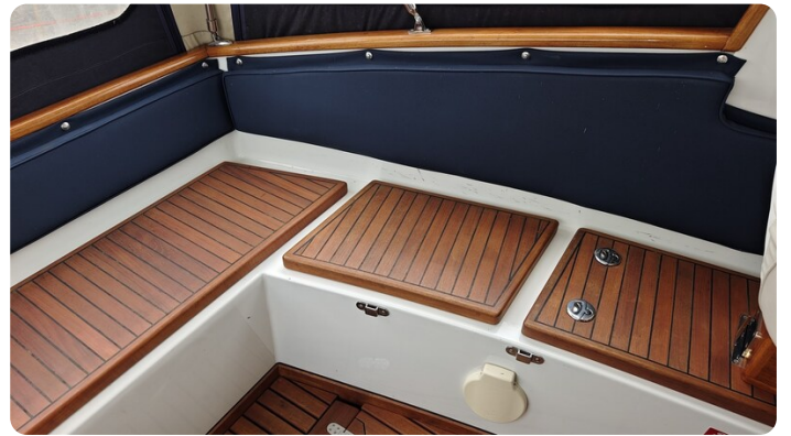
Spitzgatt Kutter LADY 12