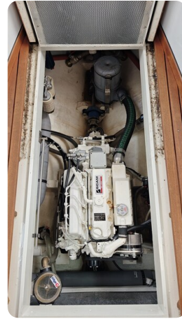
Spitzgatt Kutter LADY 11