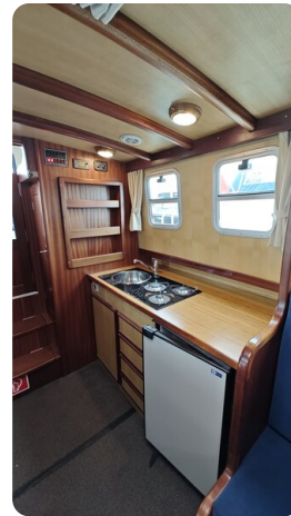
Spitzgatt Kutter LADY 16