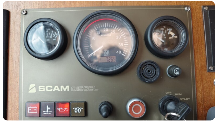
Spitzgatt Kutter LADY 22