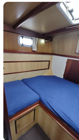
Spitzgatt Kutter LADY 20