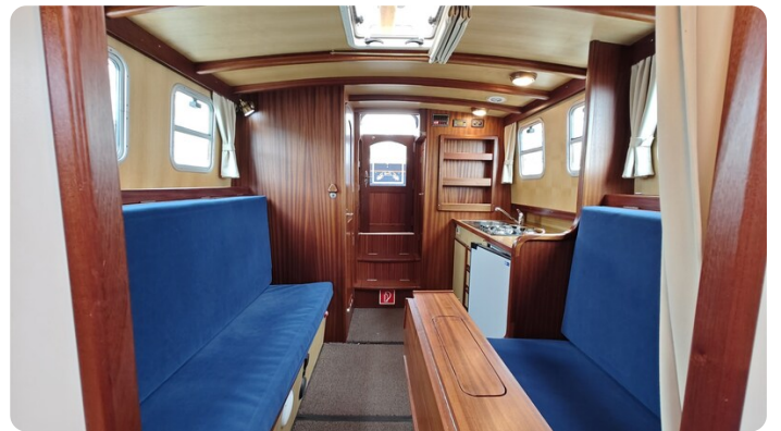
Spitzgatt Kutter LADY 14