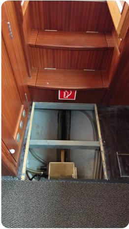
Spitzgatt Kutter LADY 21