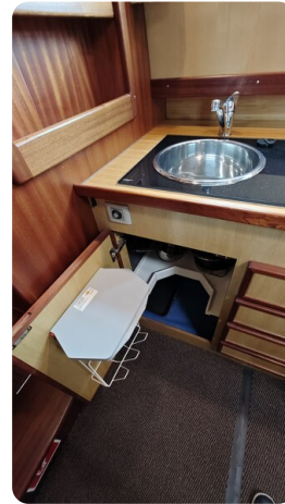
Spitzgatt Kutter LADY 18