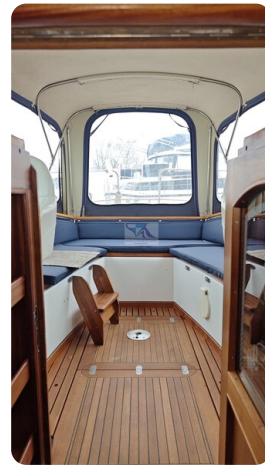
Spitzgatt Kutter LADY 61