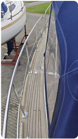
Spitzgatt Kutter LADY 9