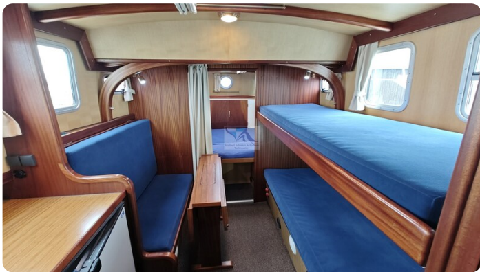
Spitzgatt Kutter LADY 78