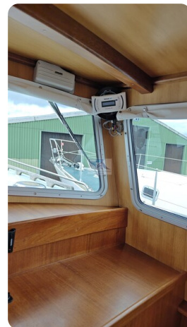
Spitzgatt Kutter LADY 30