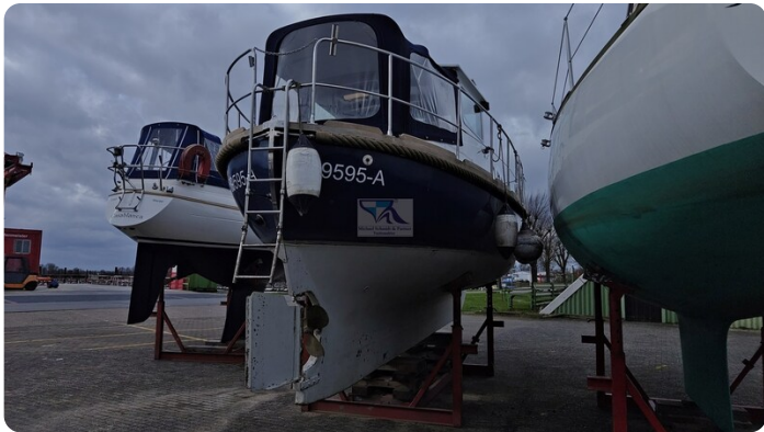
Spitzgatt Kutter LADY 1