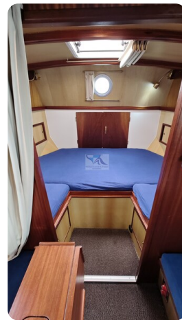
Spitzgatt Kutter LADY 84