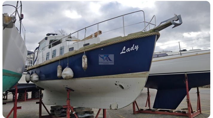
Spitzgatt Kutter LADY 7