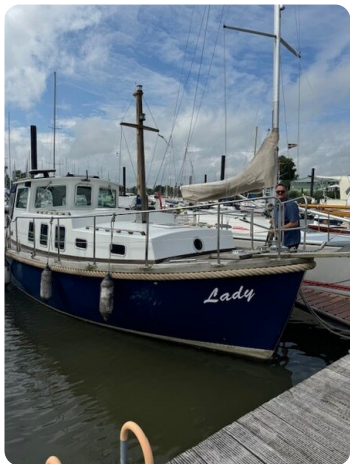
Spitzgatt Kutter Lady