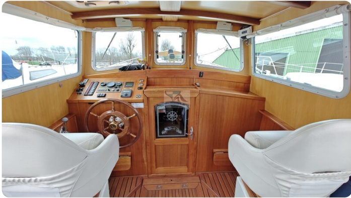
Spitzgatt Kutter LADY 28