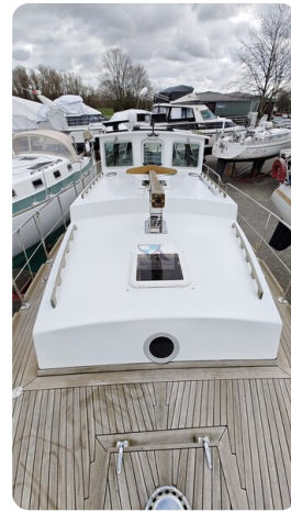
Spitzgatt Kutter LADY 18