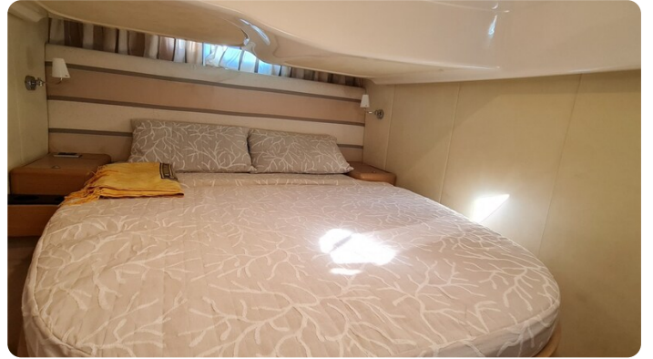
Cranchi 43 Méditerranée Vip