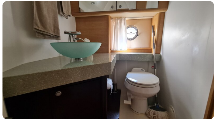
Cranchi 43 Méditerranée, bathroom view.jpg