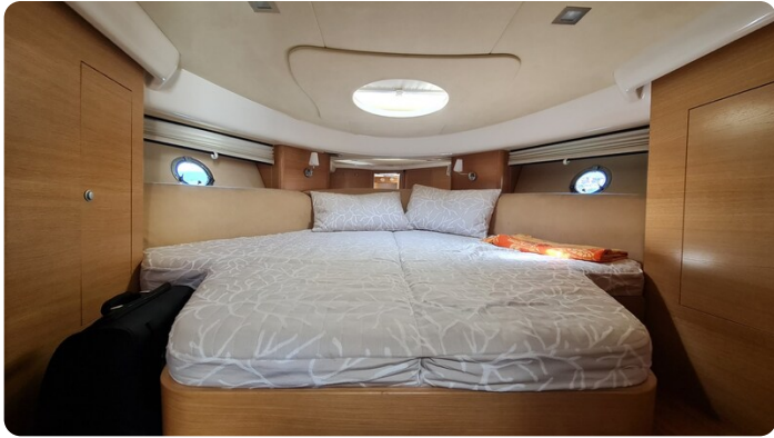
Cranchi 43 Méditerranée, owner's cabin.jpg