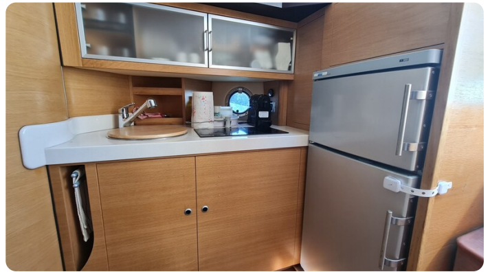
Cranchi 43 Méditerranée, galley.jpg