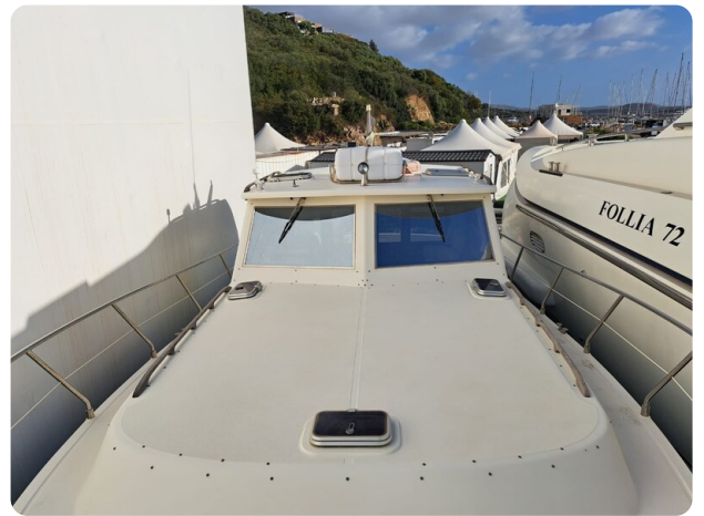
Goldstar 360 (10)