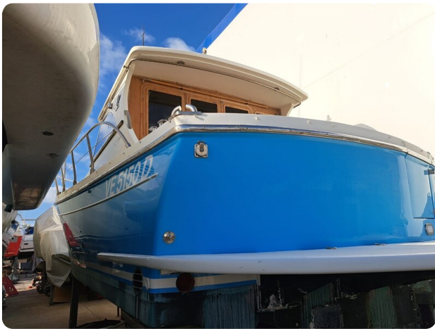
Goldstar 360 poppa