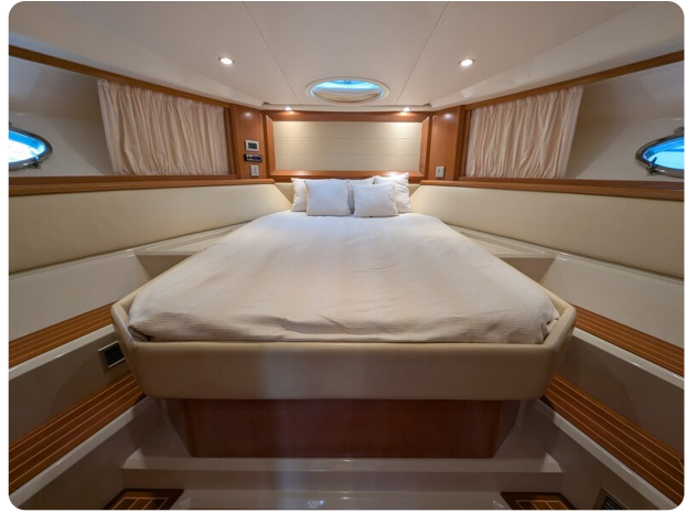
Sarnico Spider owner's cabin