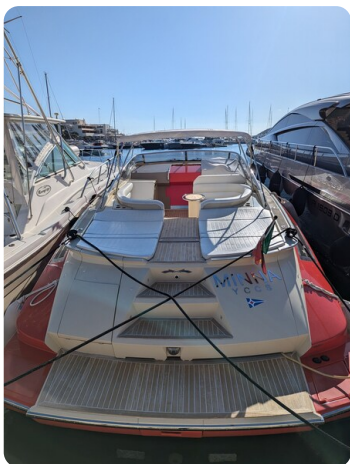
Sarnico Spider stern