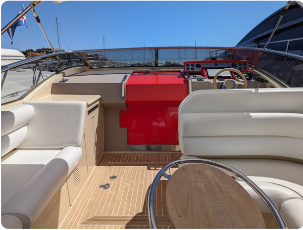
Sarnico Spider cockpit view too