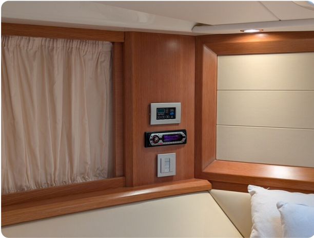
Sarnico Spider owner's cabin detail