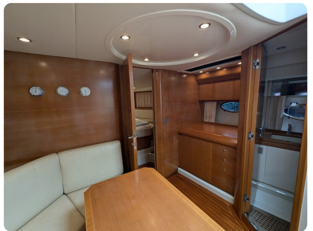
Sarnico Spider int details