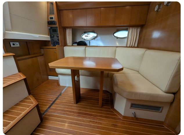
Sarnico Spider dinette