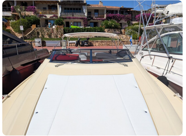
Sarnico Spider bow sunpad