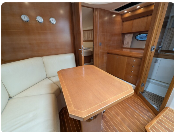
Sarnico Spider salon view