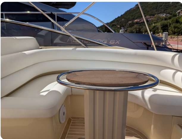
Sarnico Spider cockpit dinette