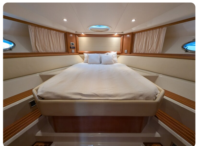
Sarnico Spider owner's cabin