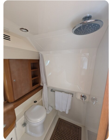
Sarnico Spider shower