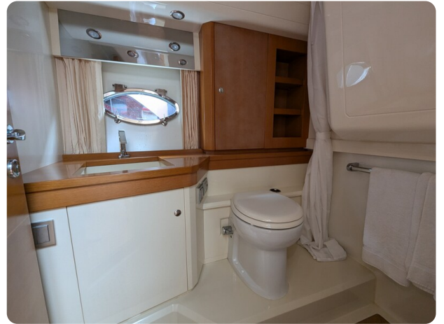
Sarnico Spider bathroom view