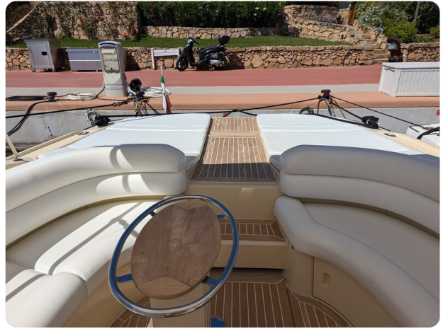
Sarnico Spider cockpit view