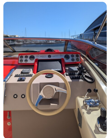
Sarnico Spider details