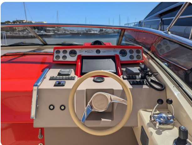
Sarnico Spider helm