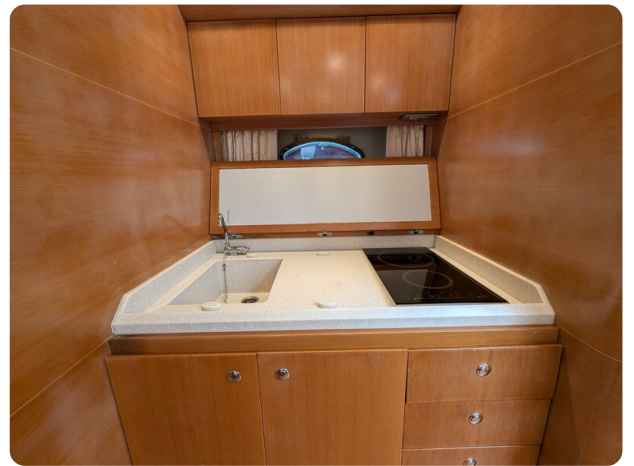
Sarnico Spider galley