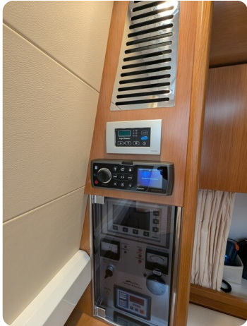
Sarnico Spider salon detail