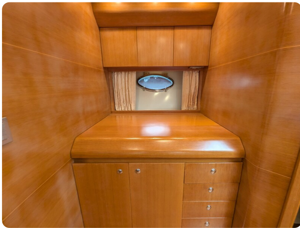
Sarnico Spider galley, closed