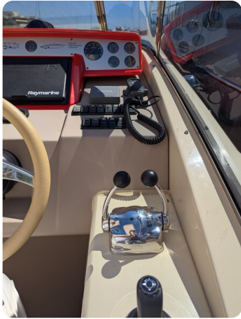
Sarnico Spider joystick