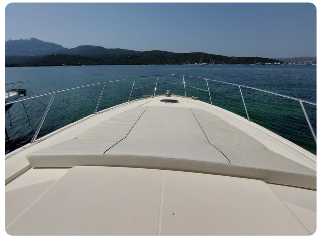
Sarnico 60 RiAl bow