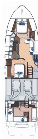
Sarnico 60 Layout.jpg