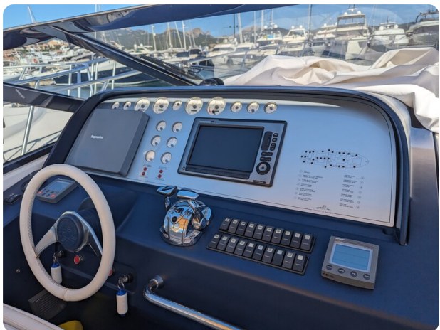
Sarnico 58 helm station