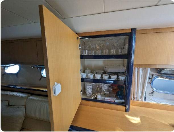
Sarnico 58 salon detail