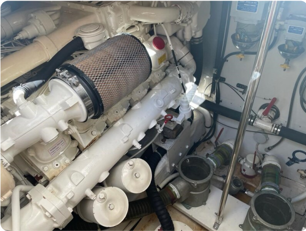
Sarnico 58 engine