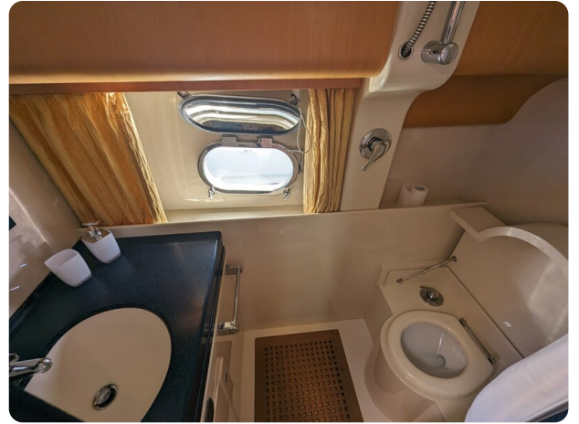
Sarnico 58 guest bathroom