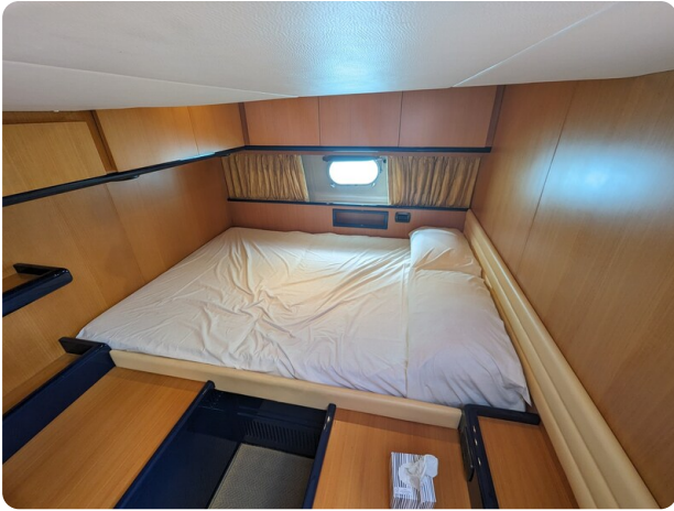
Sarnico 58 Vip cabin