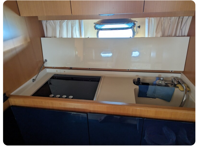
Sarnico 58 galley