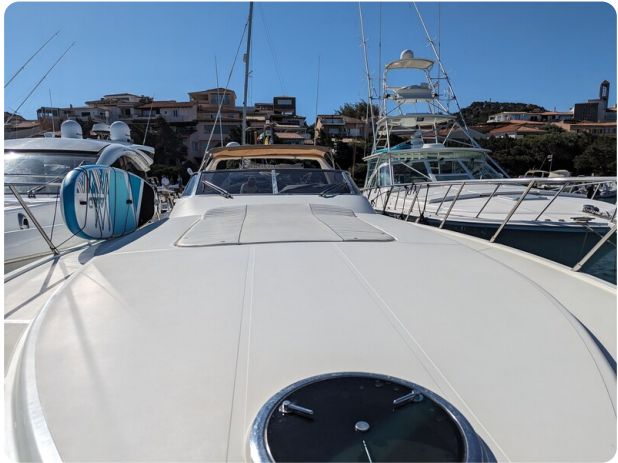
Sarnico 58 bow view