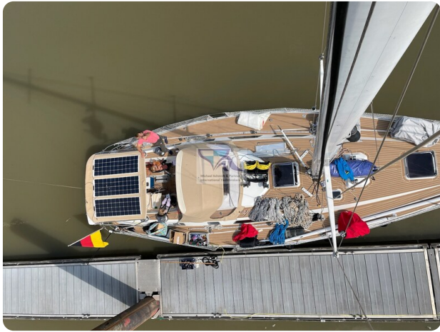
Grand Soleil 45 72