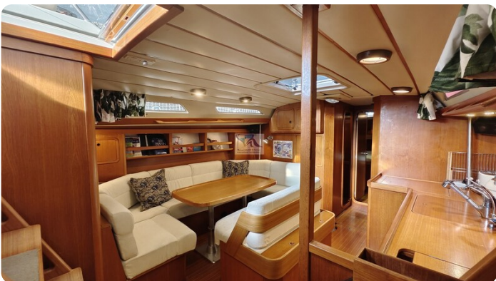
Grand Soleil 45 92