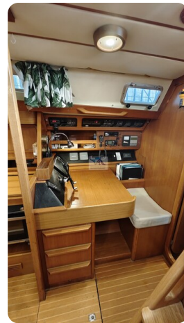
Grand Soleil 45 96