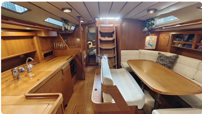
Grand Soleil 45 97