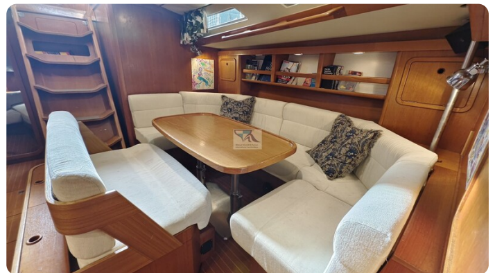
Grand Soleil 45 98