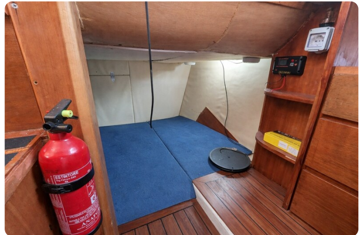
Canamer 33 aft cabin