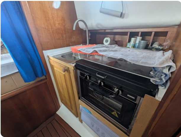
Canamer 33 galley