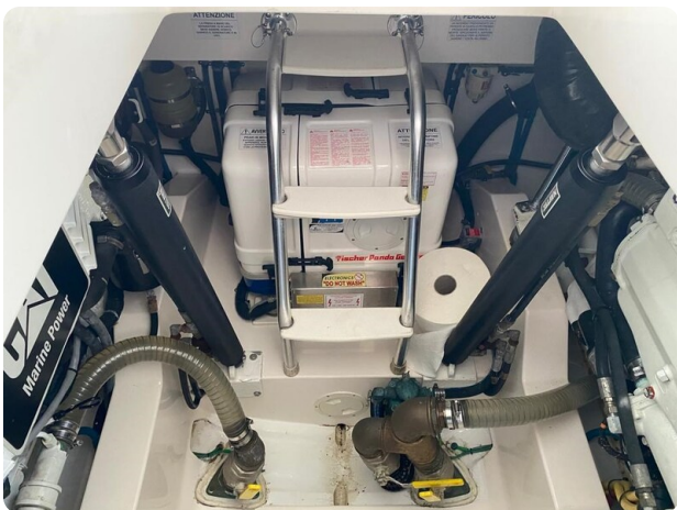
Cabo 36 Express engine room