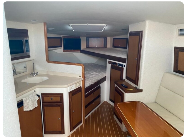
Cabo 36 Express cabin view