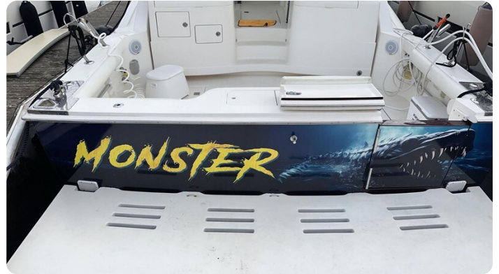
Cabo 36 Express transom view