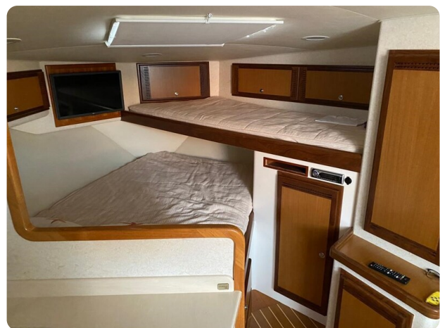
Cabo 36 Express cabin