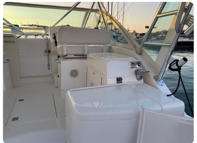
Cabo 36 Express cockpit side