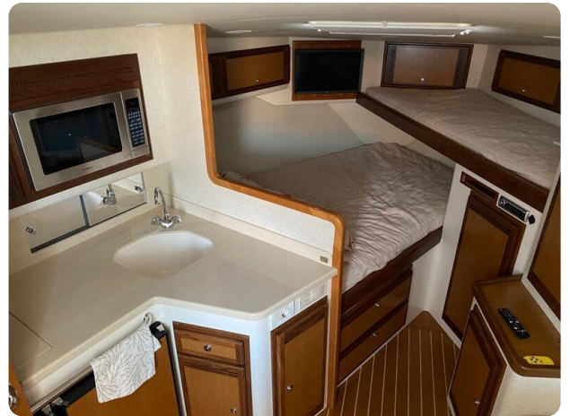
Cabo 36 Express galley and cabin view