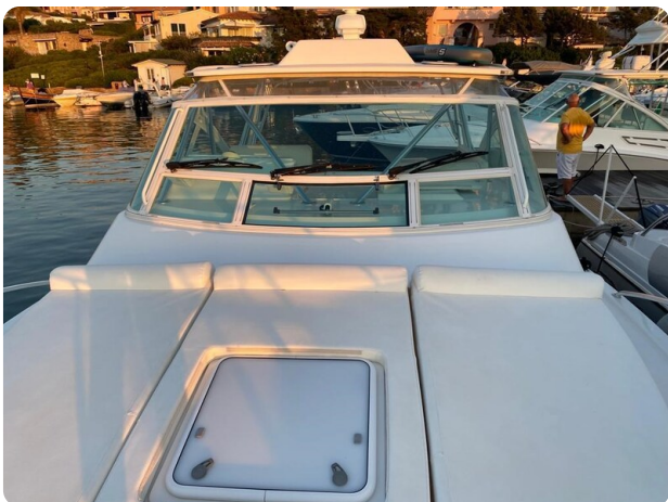
Cabo 36 Express bow deck view