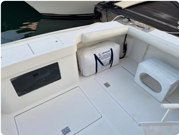
Cabo 36 Express cockpit details