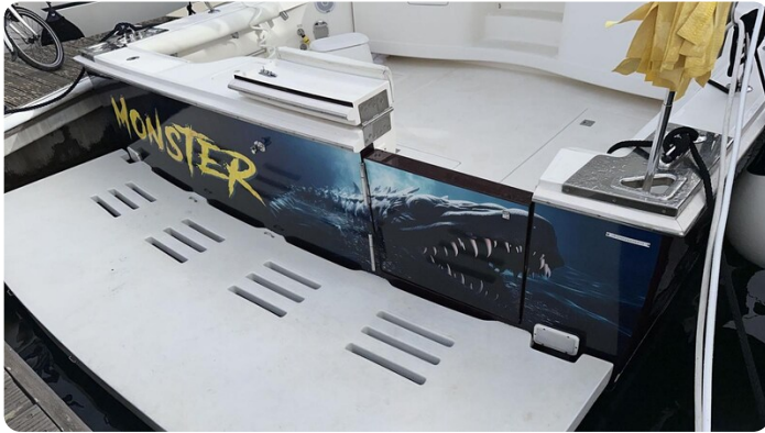
Cabo 36 Express transom detail