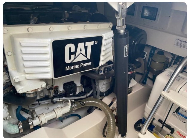
Cabo 36 Express engine detail