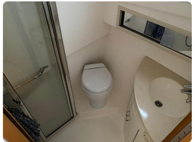
Cabo 36 Express head