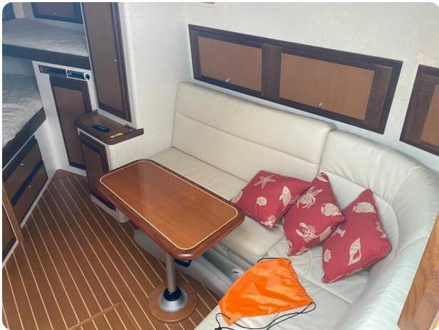
Cabo 36 Express dinette detail