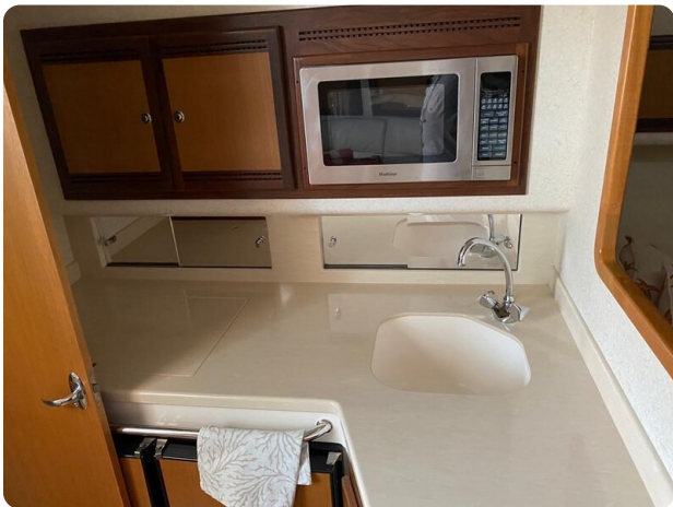
Cabo 36 Express galley