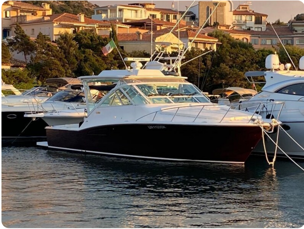
Cabo 36 Express bow profile