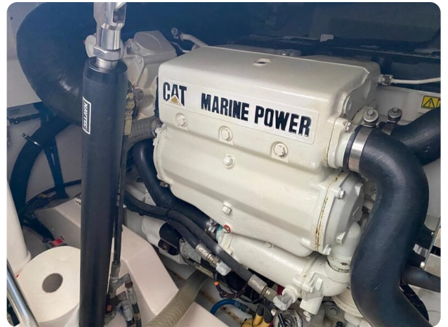
Cabo 36 Express engine