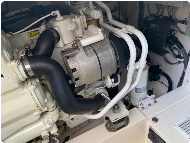
Cabo 36 Express engine room detail