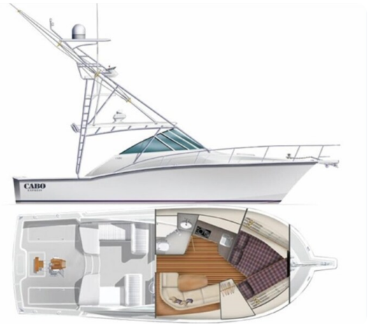
Cabo 36 Express layout