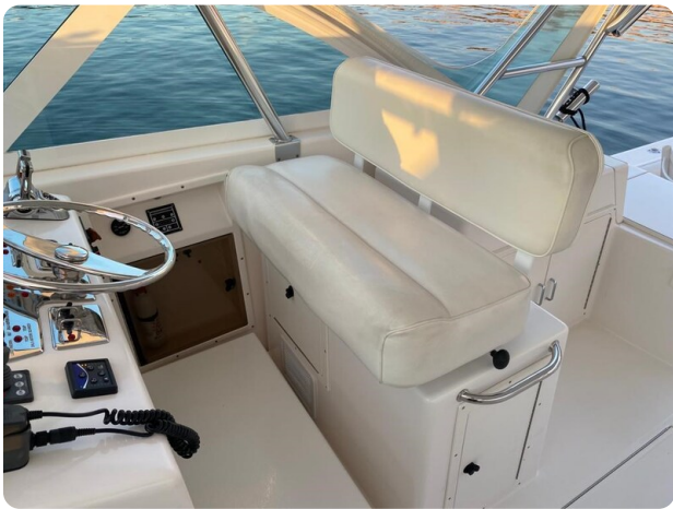
Cabo 36 Express helm station