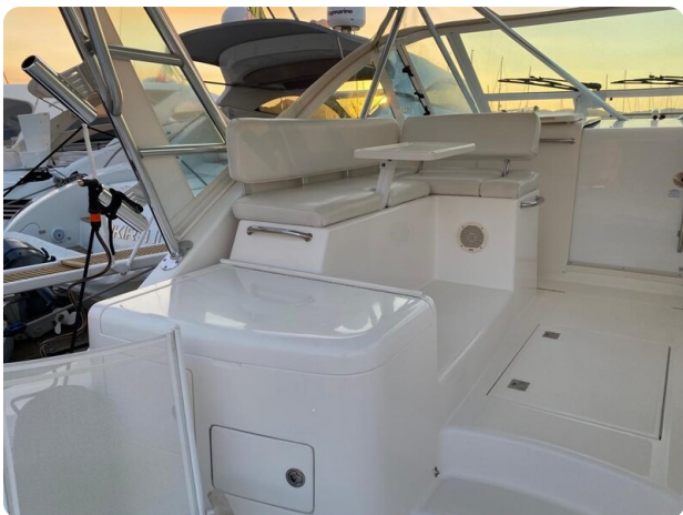
Cabo 36 Express cockpit port side