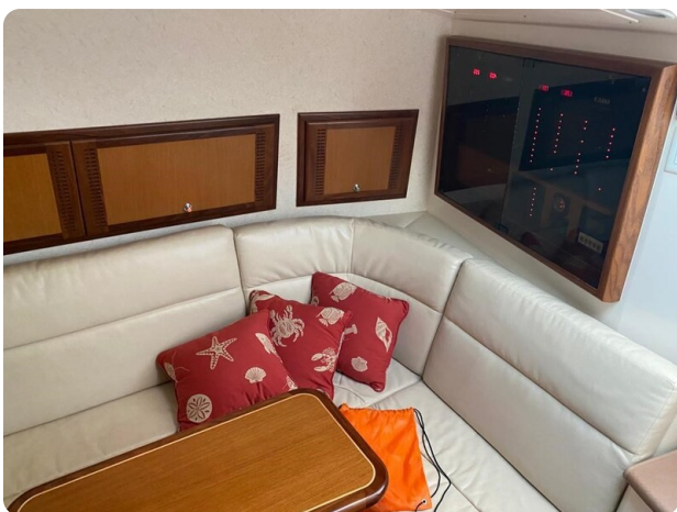
Cabo 36 Express cabin dinette