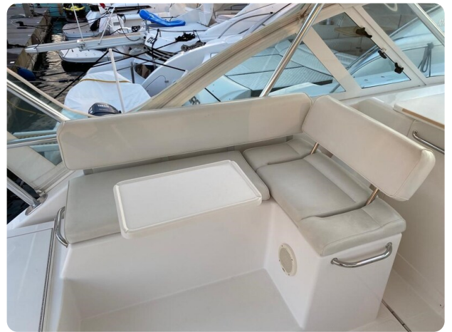
Cabo 36 Express cockpit dinette