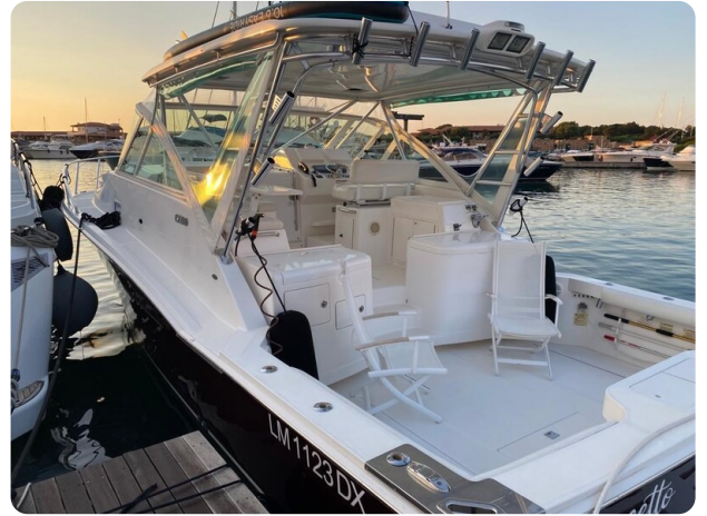
Cabo 36 Express aft profile