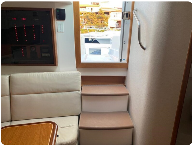
Cabo 36 Express cabin entrance