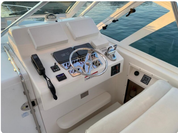
Cabo 36 Express helm station view