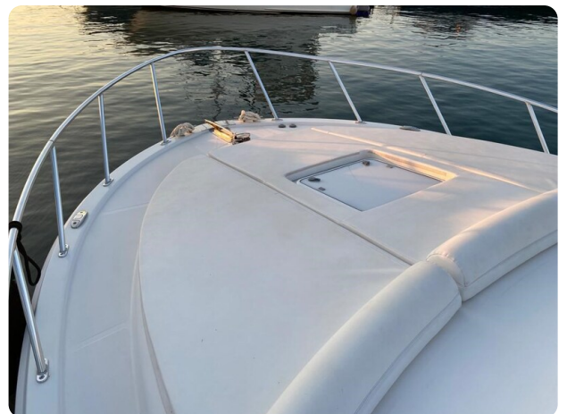
Cabo 36 Express bow deck