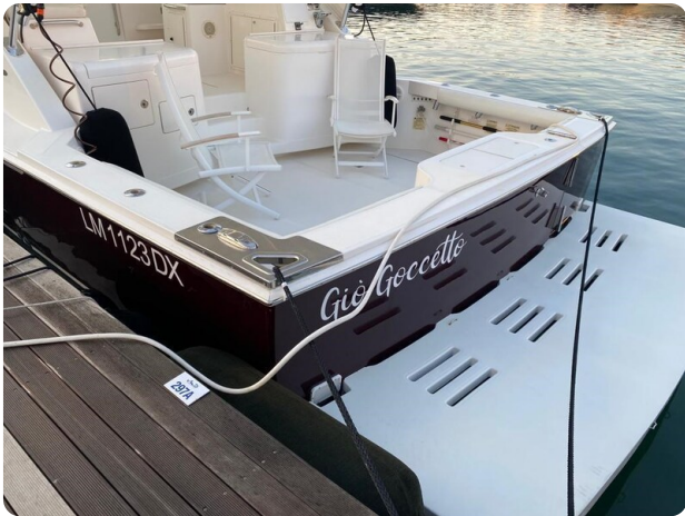
Cabo 36 Express aft detail