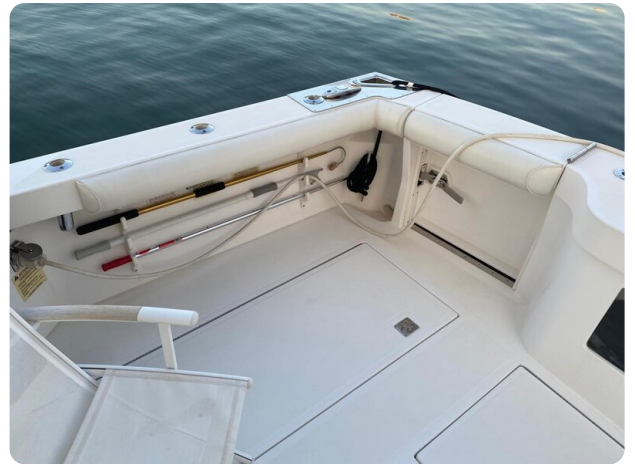
Cabo 36 Express cockpit detail