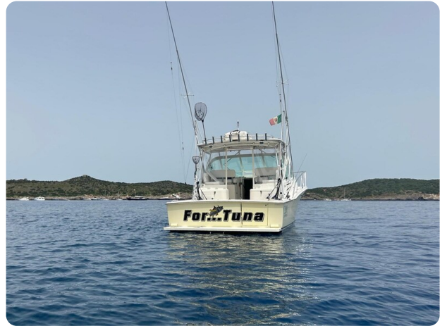
Cabo 32 Express, stern