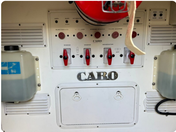
Cabo 32 Express, engine room detail