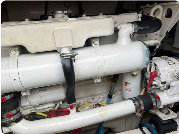
Cabo 32 Express, engine detail