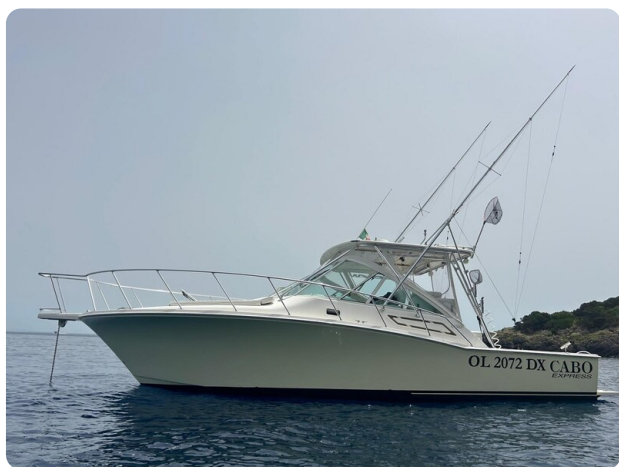
Cabo 32 Express, profile