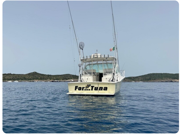
Cabo 32 Express, stern