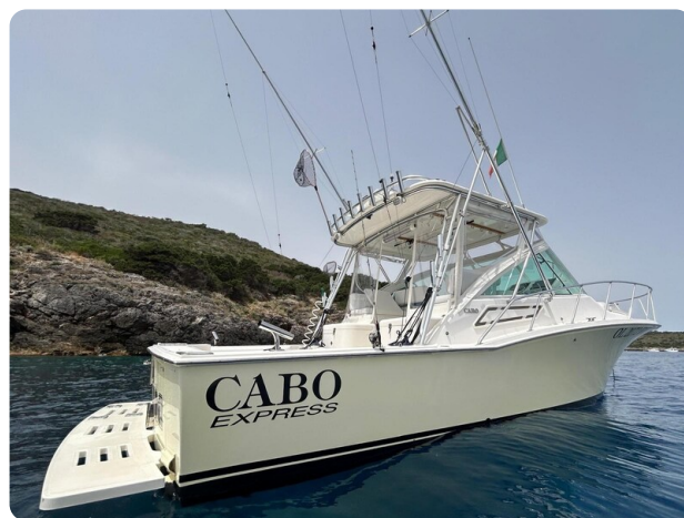
Cabo 32 Express, angle