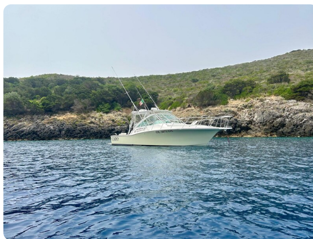
Cabo 32 Express, panoramic