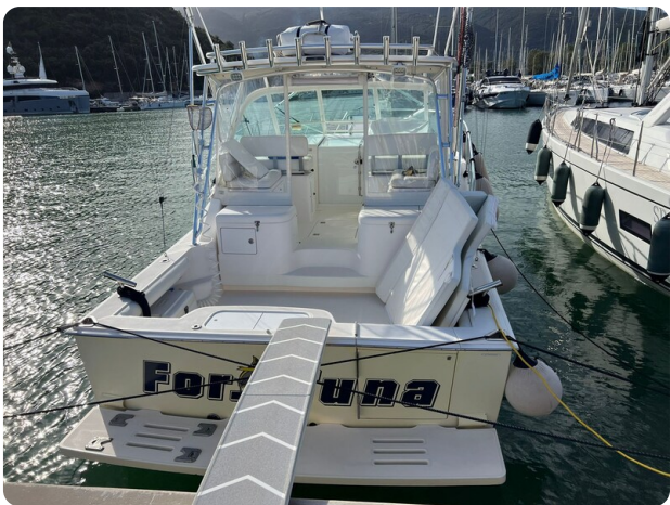
Cabo 32 Express, stern view