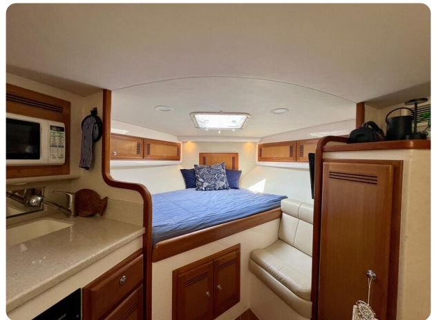
Cabo 32 Express cabin view