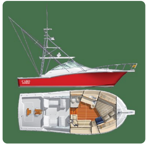
Cabo 32 Express, Layout