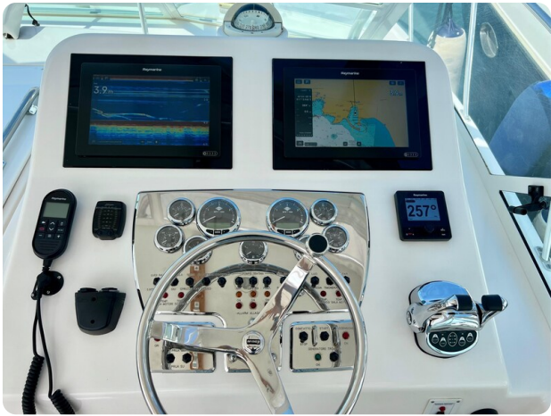
Cabo 32 Express helm