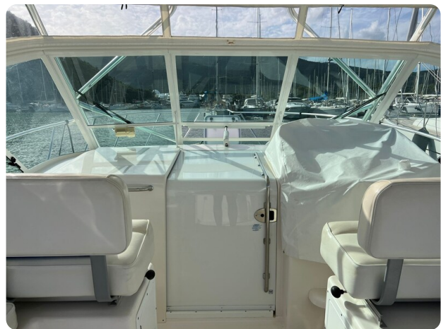
Cabo 32 Express, helm station area