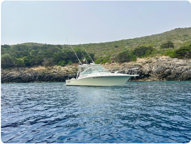
Cabo 32 Express, panoramic