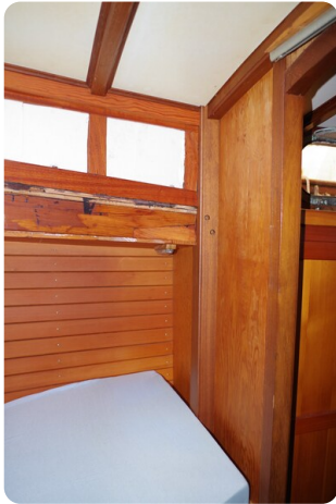
Bültjer Kutter msp625720 19